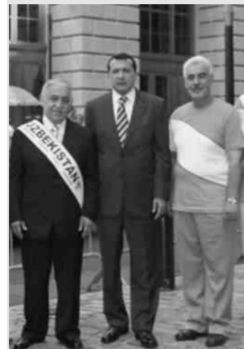
Дурбек Аманов (ўртада)

Ўзбекистон Республикасининг Германия Федератив Республикасида Фавқулодда ва мухтор элчиси этиб Дурбек Аманов тайинланган. Унинг номзоди Ўзбекистон Республикаси Олий Мажлиси Сенати томонидан тасдиқланган. Эслатиб ўтамиз, Дурбек Аманов Ўзбекистон Республикасининг Нью-Йоркдаги бош консули сифатида фаолият юритиб келган эди. Жорий йилнинг июль ойида Дурбек Аманов ваколат муддати тугаши муносабати билан ўз вазифасини топширди. Шуни қайд этиш керакки, Дурбек Аманов сўнгги уч йил давомида консул вазифасини бажариб келган эди.