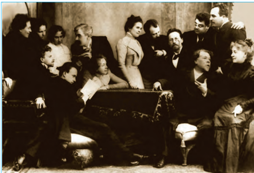
Чехов актёрлар давраида

Қалбининг қайси бир бурчакларида ҳатто Толстойда ҳам улуғлик ҳавоси сезилади. Толстойдек шахсият соҳиби учун бу айб ҳам саналмас. Лекин Чеховнинг табиати барибири