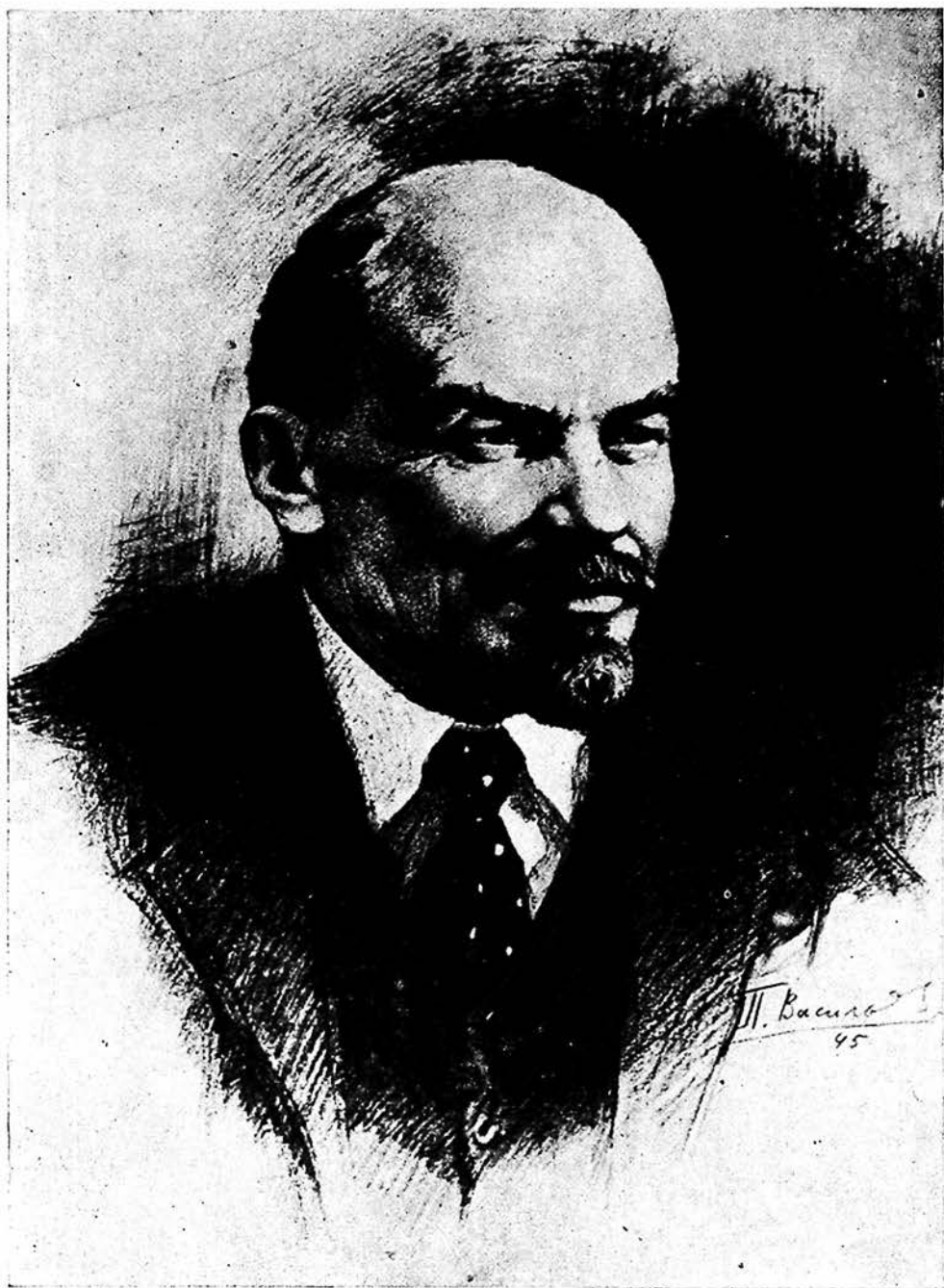
ВЛАДИМИР ИЛЬИЧ ЛЕНИН