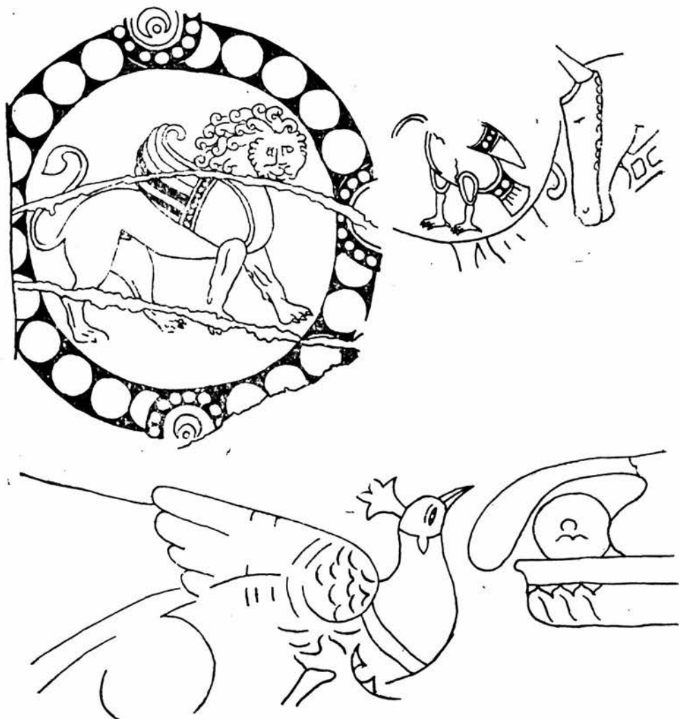
Фрагменты стеной росписей из Афрасиаба.

Подобные находки не новы для Афрасиаба: фрагменты стеной росписи попадались и раньше; однажды был вскрыт солидный кусок росписи с изображением человека в стиле VII—VIII вв. Однако из-за