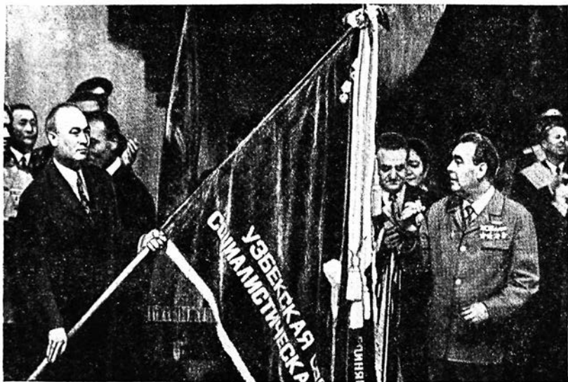
Вручение Узбекской ССР ордена Дружбы народов.