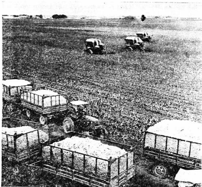
Машинный сбор хлопка.

Ныне важнейшая задача в области хлопководства — широкое развитие машинной уборки урожая, которая поглощает почти 40—50% труда, затрачиваемого на его производство. Еще в 1966 г. сбор хлопка был механизирован всего на 31%, а в 1973 г. машинами было убрано почти 2,7 млн. т сырья, или 55% урожая. Средняя выработка на одну хлопкоуборочную машину составила 98,4 т. Это позволило сократить период уборки примерно до 55 дней, вместо 80—100 дней.