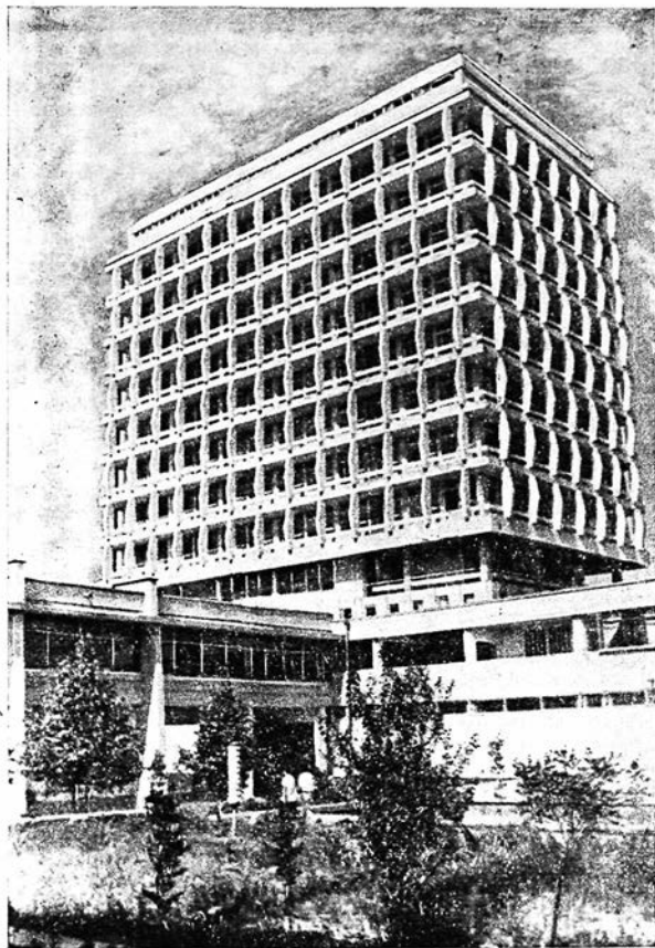
Ташкентский государственный университет им. В. И. Ленина. Главный учебно административный корпус.