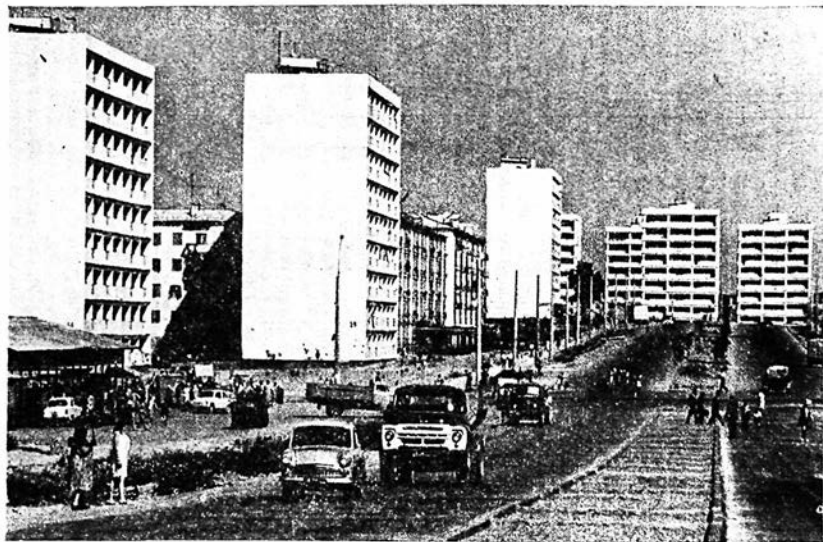
Ташкент. Квартал массива Чиланзар, возведенный строителями из Российской Федерации.