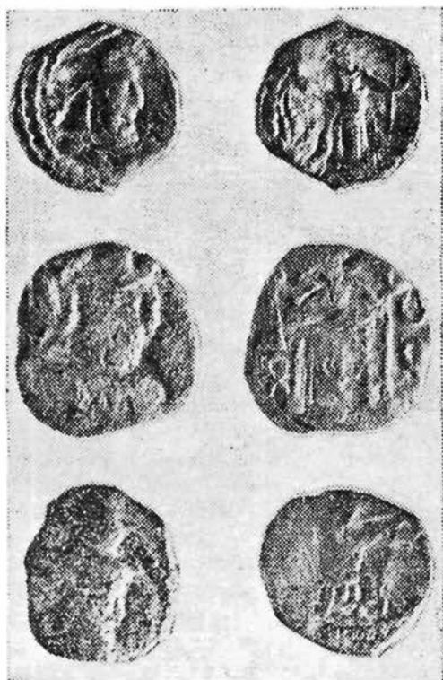
Некоторые типы сасанидских монет, найденных на юге Узбекистана.

Так, четко зафиксировано, что наиболее поздними кушанскими монетами, ходившими на территории Северной Бактрии, были монеты