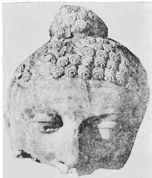
Рис. 2. Голва Будды (глина).

Фигуру Будды постигла та же участь, что и гипсовые статуи, — голова отсечена от туловища и сброшена в перевернутом виде. Она имеет трещину, нос отбит, несколько волос улиткообразной формы раздавлены. Верхняя часть прически, где волосы собраны в пучок, частично отделилась от головы, руки и плечо отсутствуют. Довольно хорошо сохранились многочисленные складки одежды и накинутый сверху плащ, ноги, стоящие на выложенном из сырцового кирпича постаменте. Все это окрашено в очень яркий красный цвет. Волосы Будды в основе черные, поверх покрыты красным цветом, брови и зрачки также оконтурены красной краской (рис. 2).