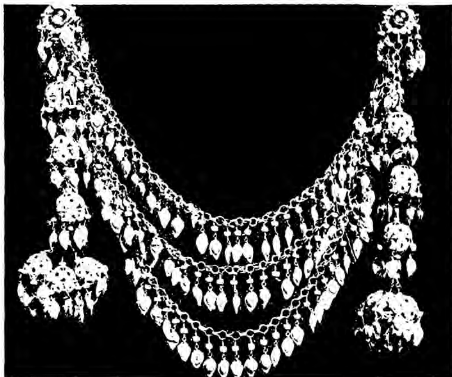
Рис. 1. Шокила. Височно-нашейная деталь. Хорезм, 2-я половина XIX в.

силсила (что в переводе означает «цепочка») в своей оптимальной форме представляла сложный трехчастный ансамбль, состоящий из налобной, височной и подбородочной частей, обрамляющих лицо. Налобная часть, которая накладывалась на головной убор (салля, касаба, шох-бош или пешонобаид), в прошлом предварительно нашивалась на широкую полосу цветного бархата или вышитой ткани и большей частью состояла из двух-трех рядов мелких 6—8-лепестковых серебряных розетт, ажурно скрепленных между собой колечками и цепочками и образующих узорную сетку. Снизу к розеттам подвешивались миниатюрные листики или бодомчики. Эти мотивы создавали ассоциации с венками или головными уборами, сплетенными из растений, которые, очевидно, и лежали в основе художественно-образного решения украшения, иногда дополненного и другими «важными» по значению мотивами, занимающими центральное место в композиции, например солнечные и звездчатые диски, мотив «турна» — «журавли» (БМ, 539—8).