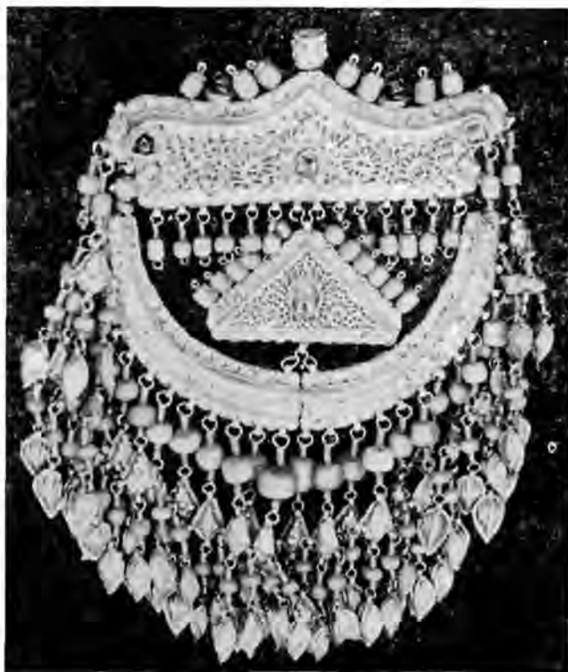
Рис. 2. Ук-ей (затылочное украшение). Хорезм, 2-я половина XIX в.

представляли Май-эне — мать-Умай в виде молодой красивой женщины, спускающейся с небес на радуге и охраняющей детей с помощью золотого лука 9 . «У тюркоязычных народов Сибири изображения лука и стрелы были связаны с культом Умай — женского духа — охранителя детей. Существовало представление, что Умай стреляет из лука в злого духа, который приближается к ребенку. У бурят лук вырезали на колыбелях, железные лучки подвешивались к колыбелям, у гняков — над люлькой, хакасы — клали в колыбель» 10 .