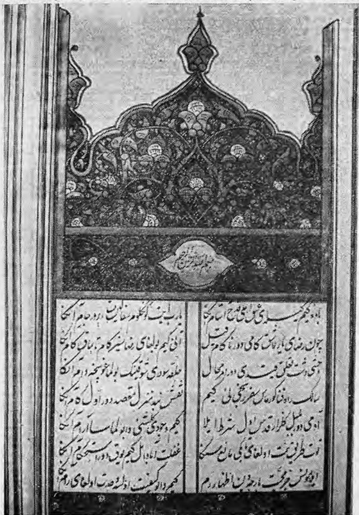
Рис. 3. Ркп. ИВ АН УзССР, инв. № 9356—3650. «Диван» Муниса. Хива. 1881 г. Унван.

Экстравагантный унван рукописи «Диван Муниса» 23 свидетельствует об экспериментальной активности оформительской мысли. Его пластическая форма, композиционное строение, соотношение с текстовой полосой, яркая декоративность, насы-