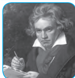
Lyudvig van Betxoven

Muzıka insanġa tásir etip, onı joqarı maqsetlerge qaray jeteleydi. Mámleketimiz Gimni jańlaġanda qálbimiz maqtanışqa toladı. Sportshılarımız jáhán maydanlarında jeńiske eriskende de Ózbekistan bayraġı kóterilip, gimnimiz jańlaydı.