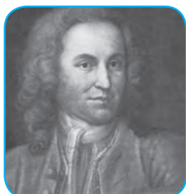
Iogann Sebastyan Bax