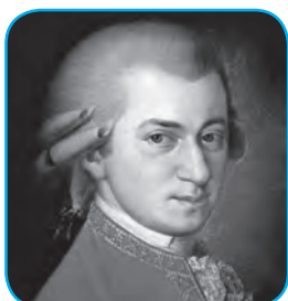
Volfgang Amadey Mocart