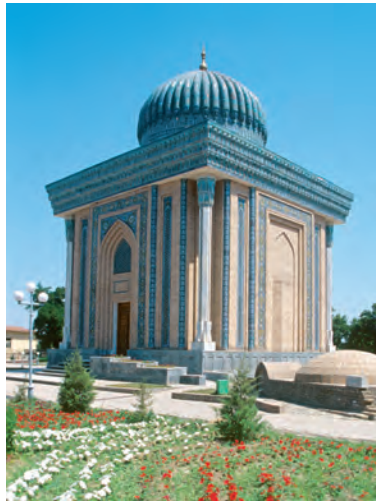
Samarqand. Imam Moturidiy maqbarasi'

Ma'selen, «bazar ideologiyasi'» degen ibarani' yesitken bolsan'i'z kerek. Bul ideologiya mu'lk formalari'nin' ha'r tu'r-liligi, pul ha'm tovarlardi'n' yerkin aylanisi', yerkin ba'sekileslik si'yaqli' ideyalar, hadalli'q, insap-diyanat, bereket, baha, qi'mbatshi'li'q, arzanshi'li'q si'yaqli' tu'sinik ha'm qa'diriyatlardi' wo'z ishine aladi'. Yaki siz u'yreniwge kirisip ati'rg'an milliy g'a'rezsizlik ideyasi'n alatug'i'n bolsaq, wol da tiykarg'i' ideyalar, basli' tu'sinik ha'm principlerdi wo'z ishine aladi'. Bu'gingi ku'nde mine usi' sistema tiykari'nda xalqi'mi'zdi'n' jan'a ideologiyasi' qa'liplesip barmaqta.