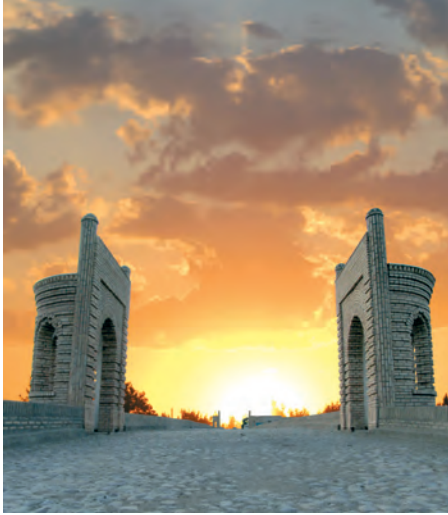
Qarshi'. Ayyemgi ko'pir