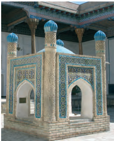
Buxara. Bahawiddin Naqshband maqbarasi'

miynette bolsi'n» degen wo'mirbag'i'sh hikmeti dinimizdin' joqari' mazmun-ma'nisin jarqi'n sa'wlelendirip, misli usi' bu'gin ayti'lg'anday jan'g'i'radi'» 1 .