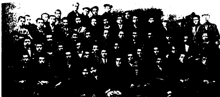
Бокуда таҳсил олган ўзбекистонлик талабалар

нов бу гал тегишли ёрдамни кўрсата олмайди. 38 Олдин Ўшдан 6300 сўм йиғилиб Бокуга юборилган эди.