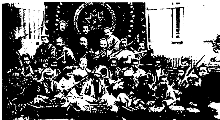
Намуна мактабида ташкил этилган мусиқа тўғараги. 1921 йил

Д) ўзбек санъати вакиллари ва илмий ходимларига ёрдам бериш;