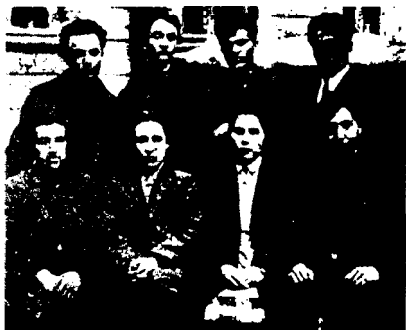
Ленинградда ўқиган ўзбекистонлик талабаларнинг «Шарқ уйи» қошидаги ўзбек секциясининг идора жамияти. 1928 йил июнь

бир жамият очиш ва шу жамият расмийлашганидан сўнг матбуотда эълон қилиниши билан дарҳол шу жамиятнинг ҳар ерда шуъбаларини очишга киришсинлар» 17 , – деб қарор қилинди. Бироқ бу хитобда илгари сурилган мақсадларни амалга ошириш учун совет ҳукумати томонидан умуман имкон берилмади.