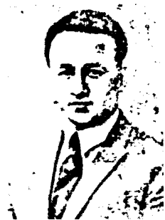
Абдуваҳҳоб Муродий. Берлин. 1926 йил

Абдуваҳҳоб Муродий Берлин олий зироат мактабини бу йил битирди. Ўзбекистондан биринчи дипломли агроном бўлиб етишди. Тошкентда энг камбағал оиладан чиққан Муродий Ўзбекистон учун энг муҳим бўлган пахта ишларини ҳар томондан ўрганиш учун ҳукумат томонидан Амриқога юборилмоқчи эса-да, ҳозирча Миср-гина бориши мумкин бўлди. Мисрда Пахта жинсини яхшилаш институти-да тажриба қилур. Сўнгра Нил бўйлаб (то Судан ўлкаси ичигача) бориб, зироат ташкилотларини ўрганур ва қайтишда Италия ва Можористон ўлкаларига тушиб ундаги ипакчилик, биринж ва чорвачилик ишлари билан танишмоқчи.