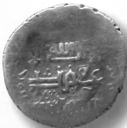
90. Танга, Амир Темур ва Маҳмуд. Қум. Санаси сийқаланиб кетган. В=5,84 гр. Д=24–28мм. кумуш, яхши. ЎзТДМ. КП–2004/23. фото сурат № 90