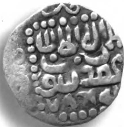
5. Танга, Амир Темур ва Суюргатмиш. Хоразм. Санаси сийқаланиб кетган. В=7,05 гр. Д=25–27мм. кумуш, яхши. ЎзТДМ. Н– 401/300. фото сурат № 5