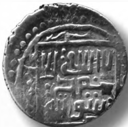
94. Мири, Амир Темур ва Маҳмуд. Хоразм. 791/1388–89. В=1,45 гр. Д=15–16мм. кумуш, яхши. ЎзТДМ. КП–2004/27. фото сурат № 94