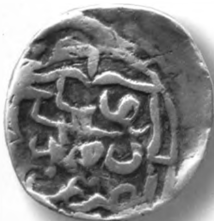
66. Фулус, Темурийлар. Хисор. В=9,52 гр. Д=26–27мм. мис, яхши. ЎзТДМ. Н–154/218. фото сурат № 66