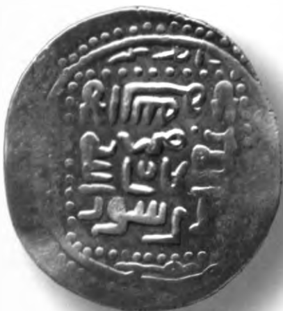
86. Танга, Амир Темур ва Маҳмуд. Кашон. Санаси сийқаланиб кетган. В=6,04 гр. Д=24–26мм. кумуш, яхши. ЎзТДМ. КП–2004/19. фото сурат № 86