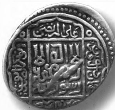
54. Танга, Султон Али Мирзо. Самарқанд. 904/1498. В=4,66 гр. Д=24–25мм. кумуш, яхши. ЎзТДМ. Н–154/205. фото сурат № 54