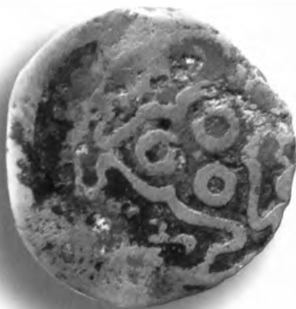
9. Фулус, Амир Темура. Самарқанд. 785/1383. В=4,13 гр. Д=25–27мм. мис. ЎзТДМ. Н–47/7. фото сурат № 9