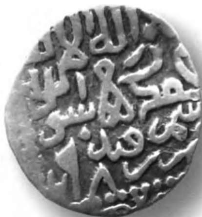
11. Мири, Амир Темур ва Маҳмуд. Самарқанд. 793/1391. В=1,51 гр. Д=14–16мм. кумуш, яхши. ЎзТДМ. Н–47/21. фото сурат № 11