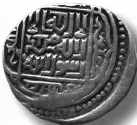
58. Танга, Султон Ҳусайн. Ҳирот. Санаси сийқаланиб кетган. В=4,71 гр. Д=24мм. кумуш, яхши. ЎзТДМ. Н-154/207. фото сурат № 58