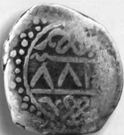
64. Фулус, Хирот. 888/1483. В=2,88 гр. Д=18мм. мис, яхши. ЎзТДМ. Н-21/111. фото сурат № 64