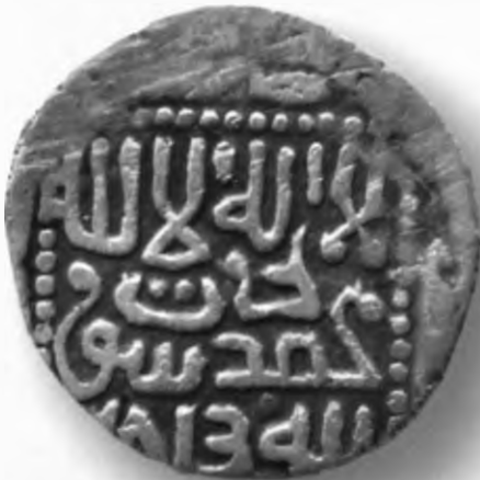
3. Мири, Амир Темур ва Суюргатмиш. Самарқанд. 786/1384. В=1,45 гр. Д=16–16,5мм. кумуш, яхши. ЎзТДМ. Н–401/57. фото сурат № 3