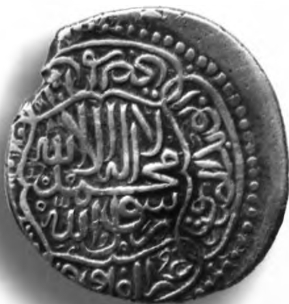
52. Танга, Султон Аҳмад. Санаси сийқаланиб кетган. В=4,78 гр. Д=26–27мм. кумуш, яхши. ЎзТДМ. Н–21/98. фото сурат № 52