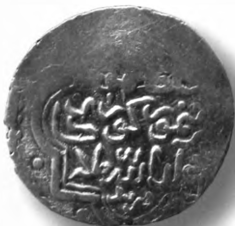
74. Танга, Амир Темур ва Маҳмуд. Домгон. Санаси сийқаланиб кетган. В=6,07 гр. Д=27мм. кумуш, яхши. ЎзТДМ. КП-2004/7. фото сурат № 74