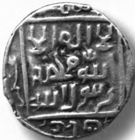
39. Танга, Шоҳруҳ. Самарқанд. 847/1443. В=5,13 гр. Д=22–23мм. кумуш, яхши. ЎзТДМ. Н–112/70. фото сурат № 39