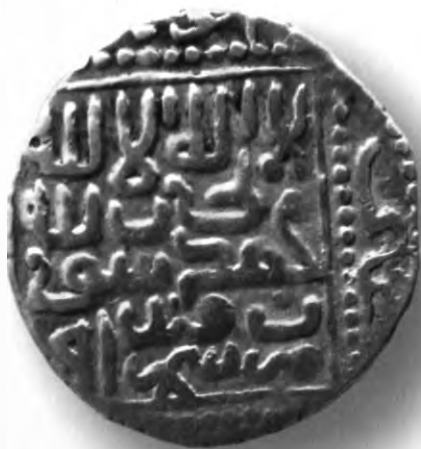
7. Мири, Амир Темур ва Маҳмуд. Самарқанд. 791/1388. В=1,59 гр. Д=17мм. кумуш, яхши. ЎзТДМ. Н- 154/169. фото сурат № 7