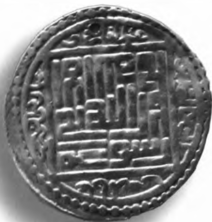
80. Танга, Амир Темура ва Маҳмуд. Сова. Санаси сийқаланиб кетган. В=6,02 гр. Д=24–25мм. кумуш, яхши. ЎзТДМ. КП–2004/13. фото сурат № 80