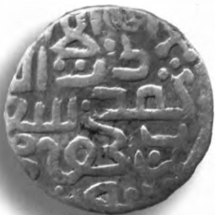
13. Мири, Амир Темур ва Маҳмуд. Самарқанд. 800/1397–98. В=1,49 гр. Д=16–16,5мм. кумуш, яхши. ЎзТДМ. Н–401/192. фото сурат № 13