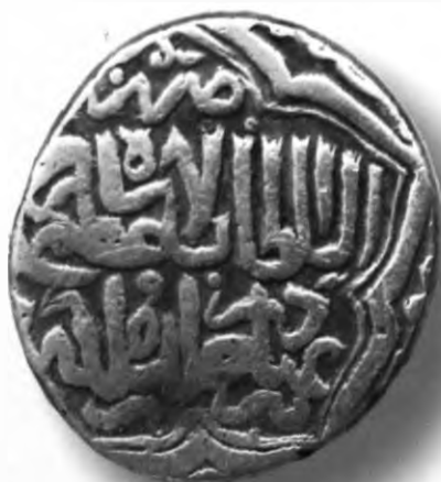
43. Танга, Шоҳруҳ. Сабзавор. 827/1424. В=5,12 гр. Д=22–24мм. кумуш, яхши. ЎзТДМ. Н–47/56. фото сурат № 43