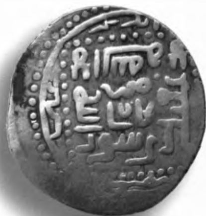
21. Танга, Амир Темур ва Маҳмуд. Язғ. 797/1394–95. В=5,94 гр. Д=24–28мм. кумуш, яхши. ЎзТДМ. Н–401/282. фото сурат № 21