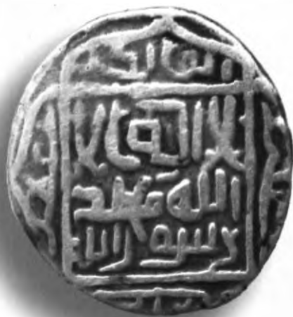
33. Танга, Шоҳруҳ. Аспара. 841/1437. В=5,07 гр. Д=19–19,5мм. кумуш, яхши. ЎзТДМ. Н–47/66. фото сурат № 33