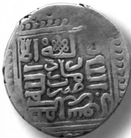
23. Танга, Амир Темура ва Маҳмуд. Қум. Санаси сийқаланиб кетган. В=5,85 гр. Д=24–25мм. кумуш, яхши. ЎзТДМ. Н–401/289. фото сурат № 23