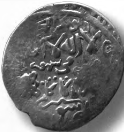
98. Танга, Амир Темур ва Маҳмуд. Шероз. 800/1397. В=6,33 гр. Д=25–289мм. кумуш, яхши. ЎзТДМ. КП–2004/31. фото сурат № 98