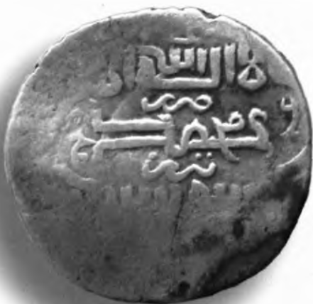
25. Танга, Амир Темур ва Муҳаммад Султон. Султония. Санаси сийқаланиб кетган. В=6,21 гр. Д=25–29мм. кумуш, яхши. ЎзТДМ. Н–401/295. фото сурат № 25