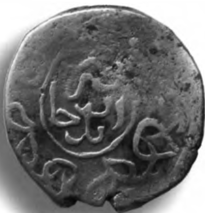
60. Танга, Султон Ҳусайн. Таббас. Санаси сийқаланиб кетган. В=4,64 гр. Д=24мм. кумуш, яхши. ЎзТДМ. Н-154/208. фото сурат № 60