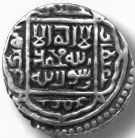
47. Танга, Улуғбек. Самарқанд. 853/1449. В=5,05 гр. Д=22–23мм. кумуш, яхши. ЎзТДМ. Н–47/81. фото сурат № 47