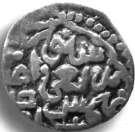
2. Мири, Амир Темури ва Суюргатмиш. Самарқанд. 785/1383. В=1,42 гр. Д=16–17мм. кумуш, яхши. ЎзТДМ. Н– 401/7. фото сурат № 2