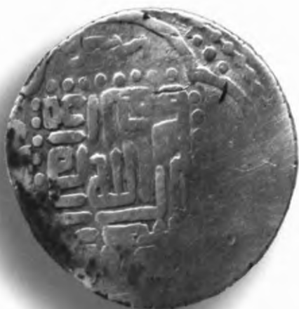
17. Фулус, Амир Тему́р. В=2,45 гр. Д=19–20мм. мис, яхши. ЎзТДМ. Н–21/39. фото сурат № 17