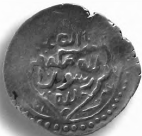
72. Танга, Амир Темур ва Маҳмуд. Боғдоғ. Санаси сийқаланиб кетган. В=6,16 гр. Д=22–24мм. кумуш, яхши. ЎзТДМ. КП–2004/5. фото сурат № 72