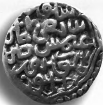
1. Мири, Амир Темури ва Суюргатмиш. Самарқанд. 783/1381–82. В=1,55 гр. Д=17мм. кумуш, яхши. ЎзТДМ. Н–401/2. фото сурат № 1