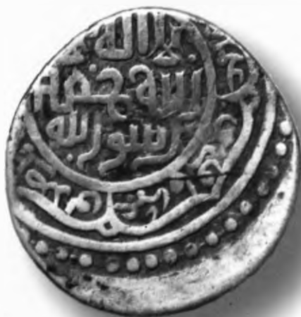
35. Танга, Шоҳруҳ. Ҳирот. 829/1426. В=5,06 гр. Д=20–22мм. кумуш, яхши. ЎзТДМ. Н-47/60. фото сурат № 35