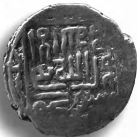
76. Танга, Амир Тему́р ва Махму́д. Дарба́нд. Санаси сийқаланиб кетган. В=6,07 гр. Д=24–25мм. кумуш, яхши. ЎзТДМ. КП–2004/9. фото сура́т № 76