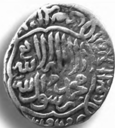
56. Танга, Ҳусайн ва тамға Бойсунқургози. Астробод. 902/1496. В=5,00 гр. Д=22мм. кумуш, яхши. ЎзТДМ. Н-154/201. фото сурат № 56