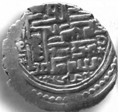
84. Танга, Амир Темур ва Маҳмуд. Язд. 797/1394–5. В=5,95 гр. Д=25мм. кумуш, яхши. ЎзТДМ. КП–2004/17. фото сурат № 84