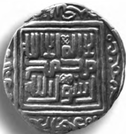
100. Танга, Амир Темур ва Маҳмуд. Шайх Абуусҳақ. 797/1394–5. В=6,25 гр. Д=25–27мм. кумуш, яхши. ЎзТДМ. КП–2004/33. фото сурат № 100