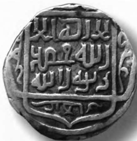
31. Мири, Муҳаммад Жаҳонгир ва Халил Султон. Самарқанд. 808/1405–6. В=1,51 гр. Д=17–17,5 мм. кумуш, яхши. ЎзТДМ. Н–401/247. фото сурат № 31