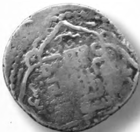
27. Танга, Амир Темур ва Маҳмуд. Шабанкара. Санаси сийқаланиб кетган. В=5,90 гр. Д=25мм. кумуш, яхши. ЎзТДМ. Н-401/302. фото сурат № 27