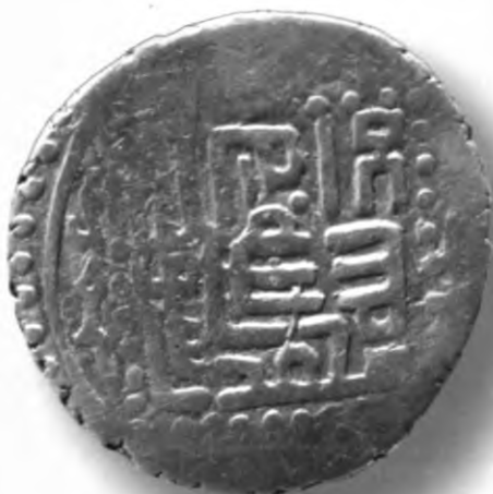
82. Танга, Мухаммад Султон. Табриз. Санаси сийқаланиб кетган. В=6,20 гр. Д=25–28мм. кумуш, яхши. ЎзТДМ. КП–2004/15. фото сурат № 82