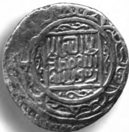
41. Танга, Шоҳруҳ. Самарқанд. Санаси сийқаланиб кетган. В=4,66 гр. Д=25мм. кумуш, яхши. ЎзТДМ. Н-154/194. фото сурат № 41