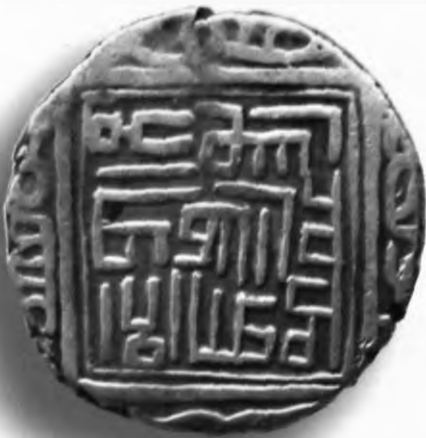
45. Фулус, Шоҳруҳ, Хоразм. 821/1418. В=4,10 гр. Д=21–22мм. мис, яхши. ЎзТДМ. Н–21/48. фото сурат № 45