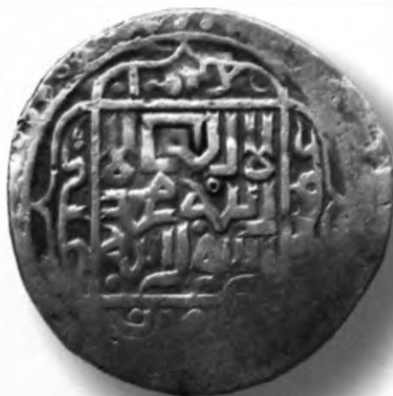
50. Фулус, Самарқанд. 854/1450–51. В=4,64 гр. Д=22–23мм. мис, яхши. ЎзТДМ. Н–21/96. фото сурат № 50