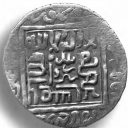
68. Танга, Амир Темур ва Маҳмуд. Андикон. Санаси сийқаланиб кетган. В=5,87 гр. Д=26мм. кумуш, яхши. ЎзТДМ. КП-2004/1. фото сурат № 68