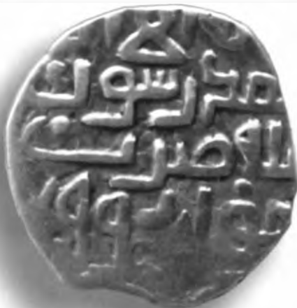
92. Ташга, Амир Темура ва Маҳмуд. Мордшн. Санаси сийқаланиб кетган. В=6,38 гр. Д=24–26мм. кумуш, яхши. ЎзТДМ. КП–2004/25. фото сурат № 92