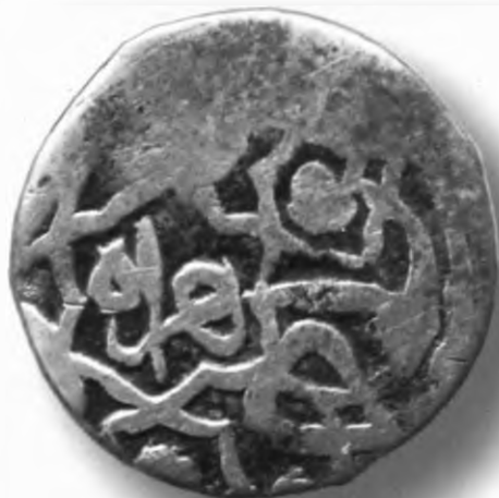
62. Фулус, Бухоро. 874/1469. В=3,46 гр. Д=21,5мм. мис, яхши. ЎзТДМ. Н-21/99. фото сурат № 62