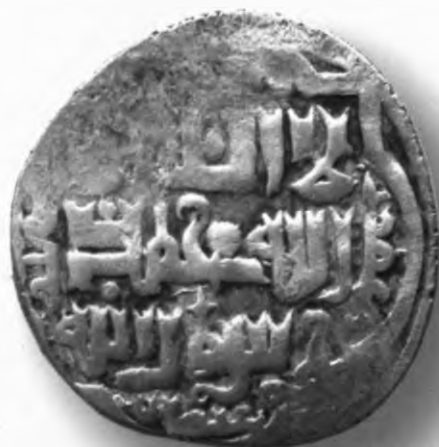
15. Танга, Амир Темур ва Маҳмуд. Шероз. 800/1397–98. В=6,24 гр. Д=24–26мм. кумуш, яхши. ЎзТДМ. Н–401/303. фото сурат № 15