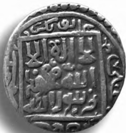
37. Танга, Шоҳруҳ. Самарқанд. 831/1427. В=4,52 гр. Д=21мм. кумуш, яхши. ЎзТДМ. Н-21/59. фото сурат № 37