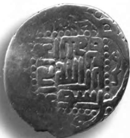
96. Танга, Амир Темура ва Маҳмуд. Шабанкара. Санаси сийқаланиб кетган. В=6,14 гр. Д=26–29мм. кумуш, яхши. ЎзТДМ. КП–2004/29. фото сурат № 96