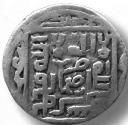
19. Танга, Амир Темур ва Маҳмуд. Бамиян. 799/997/1397–98. В=5,95 гр. Д=28–30мм. кумуш, яхши. ЎзТДМ. Н–401/294. фото сураат № 19