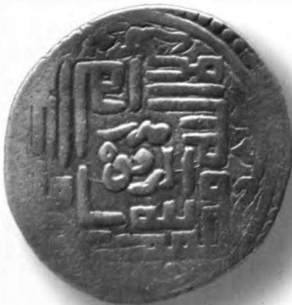
78. Танга, Амир Темур ва Маҳмуд. Исфахон. Санаси сийқаланиб кетган. В=6,16 гр. Д=26,5мм. кумуш, яхши. ЎзТДМ. КП-2004/11. фото сурат № 78