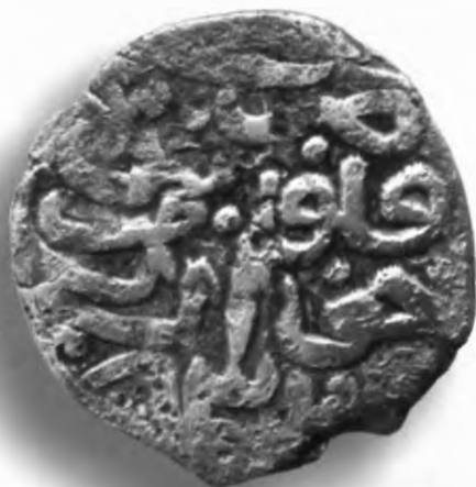
48. Фулус, Улуғбек. Шоҳруҳия. 832/1428. В=7,56 гр. Д=23–26мм. мис, яхши. ЎзТДМ. Н–21/76. фото сурат № 48