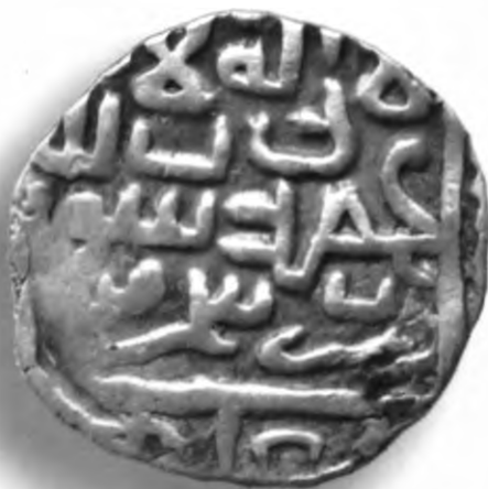
29. Танга, Амир Темури ва Маҳмуд Шероз. Самарқанд. Санаи сийқаланиб кетган. В=6,15 гр. Д=23–24,5мм. кумуш, яхши. ЎзТДМ. Н–401/304. фото сурат № 29