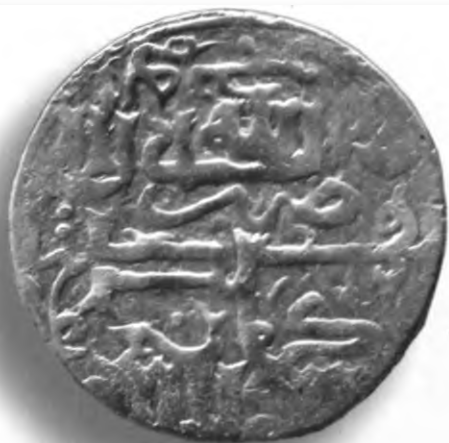
88. Танга, Амир Темура ва Маҳмуд. Кермон. Санаси сийқаланиб кетган. В=6,19 гр. Д=25–27мм. кумуш, яхши. ЎзТДМ. КП–2004/21. фото сурат № 88