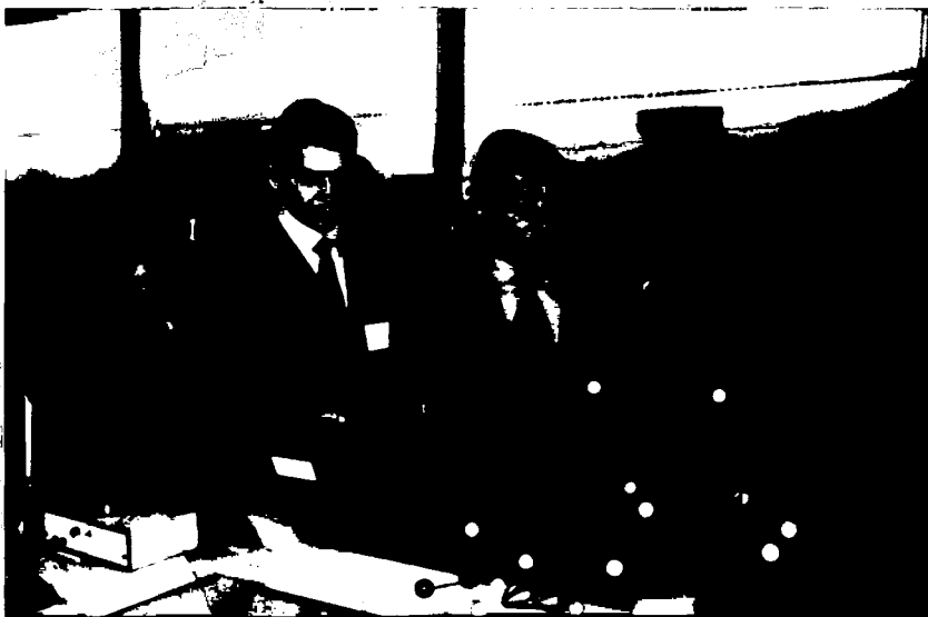
Таълим жиҳозлари кўргазмасида