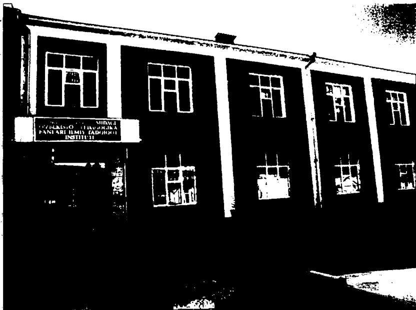
Институт янги биноси