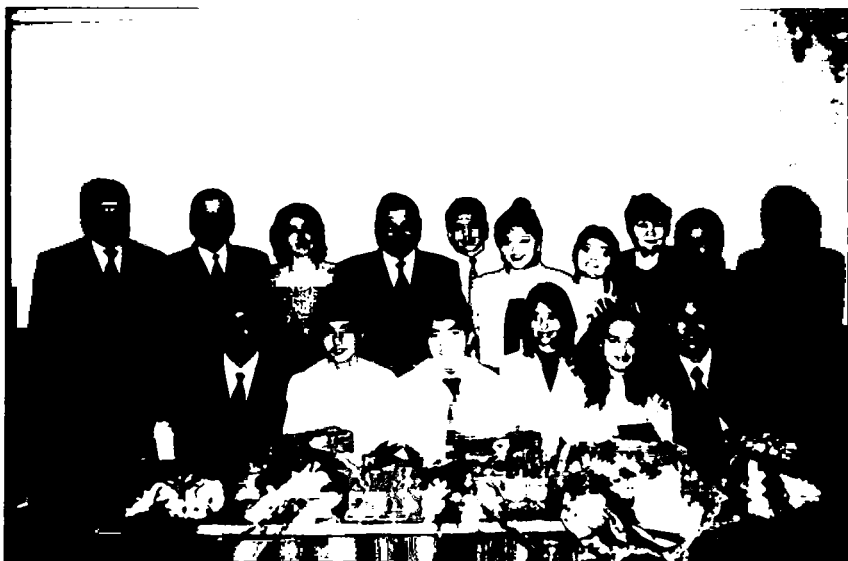
Келажаги буюк Ўзбекистон ёшлари давраида