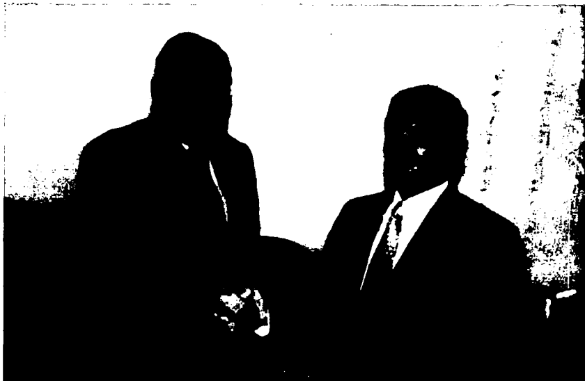
Япония элчиси билан мулоқотда