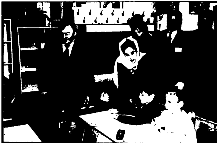
Мактабларимиз моддий базасини мустаҳкамлаш йўлида