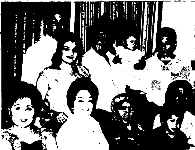
Оила даврасида www.ziyouz.com kutubxonasi