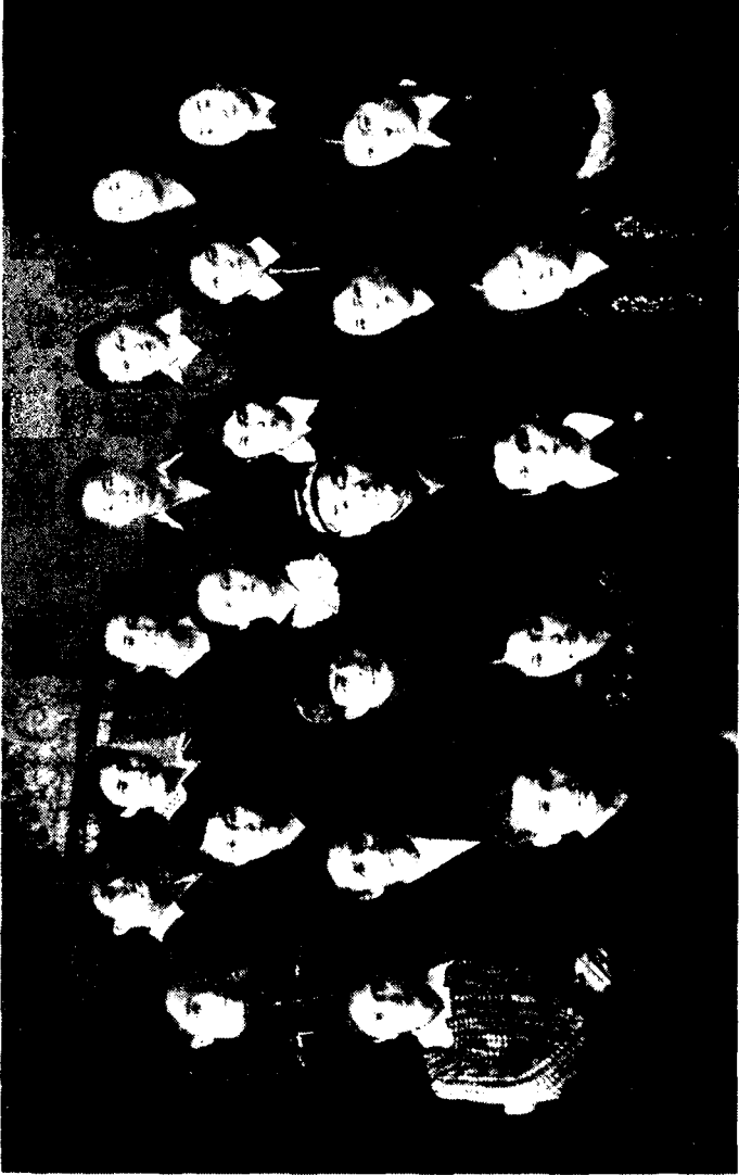
Х. Зиёев Тобольск давлат педагогика институти талабалари орасида