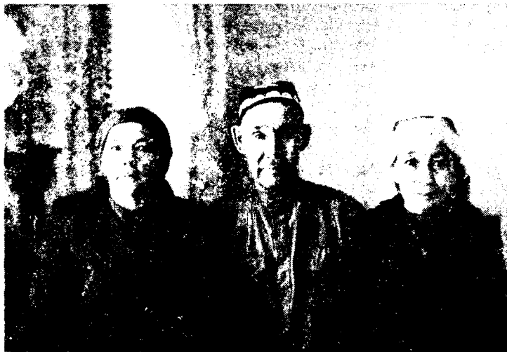
Сибирдаги ўзбекларнинг авлодлари

Сибирга ўрнашувчи бухоролик ва тошкентликларга уй-жой қуриш ва ер эгаллаш каби имтиёзлар берилган бўлиб, бу, шубҳасиз, улар сонининг кўпайишида муҳим роль ўйнаган. Бухоролик ва тошкентликлар фақат Тобольск, Тара ва Тюмендагина эмас, балки Сибирь линиясига ҳам жойлашиб, Россия қарамогига ўтганлар. Жумладан, Петропавловск, Семипалатинск ва Усть-Каменогорскка тошкентликлар XVIII асрнинг иккинчи ярмидан эътиборан кўплаб ўрнаша бошлаганлар. Рус ҳукумати бухоролик ва тошкентликларнинг Сибирь линиясида турғун бўлиб қолиши учун бир қатор тадбирларни амалга оширди. Масалан, 1789 йилда Давлат кенгаши бир гуруҳ бухоролик ва тошкентликларнинг Сибирь линиясига ўрнашиши ҳақидаги илтимосини қондириб, уларни Россия таабалига