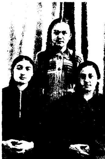
Сибирдаги ўзбекларнинг авлодлари