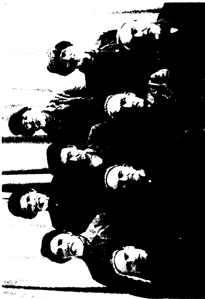
Сибирдаги ўзбеклар авлодлари