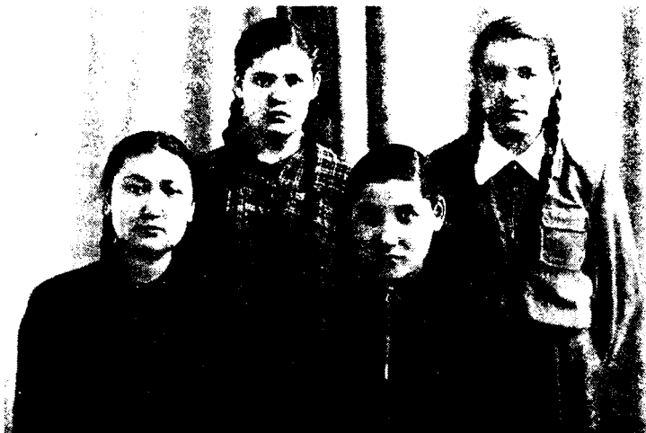
Сибирдаги ўзбекларнинг авлодлари

ларни Уфага ҳам юборганлар. Буни 1704 йилдаги божхона китобидан билиш мумкин. Унда: «Тюмень божхонаси бухоролик Матёр Дўсовга ўзининг уйда тиккан учта кийими билан Уфага боришига рухсат берди» 1 . — дейилган. Шу йили Саидов номли бухороликнинг ҳам ўз уйида тикилган тайёр кийимларни Уфага олиб кетганлиги божхона китобида қайд қилинган 2 .