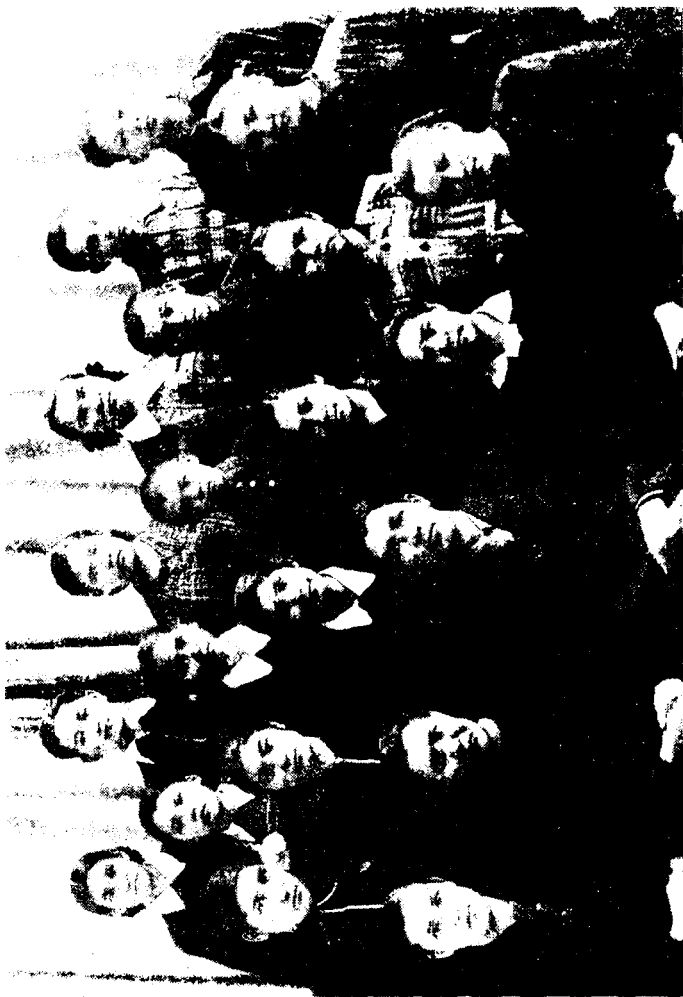
Emбoев қишлоғидаги бухоролик мактаб болалари