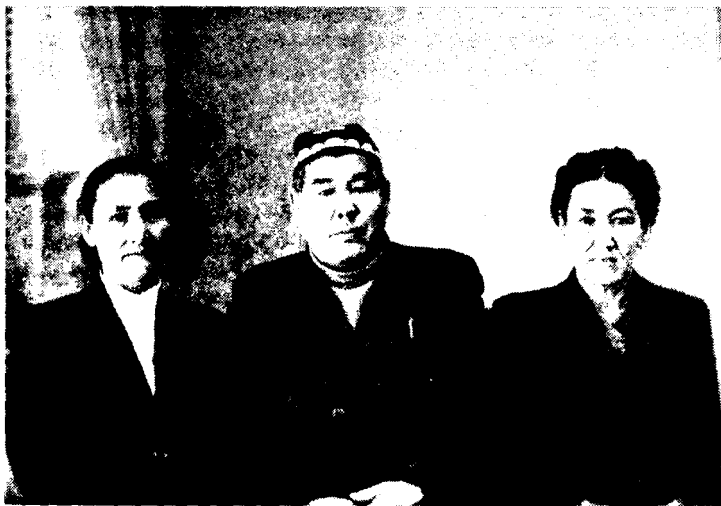
Сибирдаги ўзбекларнинг авлодлари

Рус ҳукуматининг 1785 йилги Россиядаги савдогарларнинг маблағини аниқлаш ва уларнинг савдо бўйича, бошқа граждaнлар билан бир қаторда шаҳар маҳкамасига бўйсунилшари тўғрисидаги қарорига мувофиқ, Тобольск маъмурияти бухоролик ва тошкентликларни ҳам кўрсатилган қарорга амал қилишга мажбур этди 1 . Бунга қарши бухоролик ва тошкентликлар норозилик билдирдилар ва рус ҳукуматига ариза бердилар. Аризада уларни шаҳар маҳкамасига бўйсундирмаслик ҳамда уларнинг ўз судларини ташкил этишига рухсат бериш тўғрисида рус ҳукуматидан сўралди 2 . Бунга жавобан, 1785 йилда рус императори Екатерина II Сибирь генерал-губернатори Е. П. Кашкинга қуйидагича фармон юборди: «...улар у ерда янги асосда идора этиш барпо қилингунича қадар қандай ҳолда бўлган бўлса, шундай ҳолда қолдирилсин, бундан ташқари Тобольскда ва маъқул топган жойларингизда уларнинг жамоа ва қозихоналарини тузинг, токи улар кўпайгунга қадар бизнинг губерняни бошқариш тўғрисидаги қоидаларимизга асосан, ўзларининг маҳаллий ҳокимият органларига эга бўлсинлар» 3 .