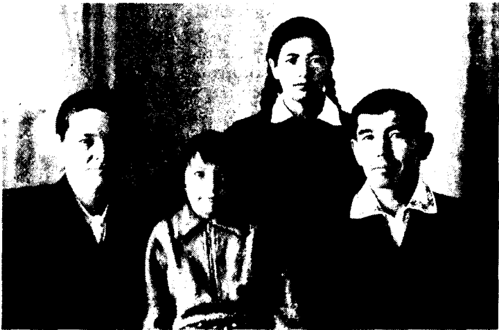
Сибирдаги ўзбекларнинг авлодлари

лияти Сибирь Россияга қўшиб олингандан сўнг янада кучайди. Бу ҳолат Сибирь билан Бухоро ва Хива хонлиги ўртасидаги савдонинг ривожланишига анча таъсир кўрсатди 1 . Бухороликлар Ўрта Осиё молларидан ташқари, маҳаллий моллар билан бўладиган савдони ҳам тобора ўз қўлларида тўплаб бордилар.