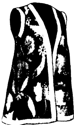
Сибирлик ўзбекларнинг кийимлари