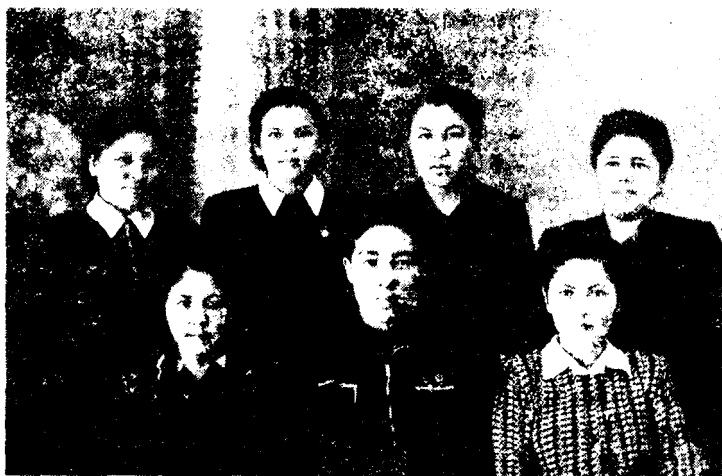
Сибирдаги ўзбекларнинг авлодлари

Осиёнинг Россия томонидан босиб олинishi натижа- сида бухороликларнинг олдинги вақтлардаги восита- чилик роли пасайиб, савдо фаолияти эса асосан, ма- ҳаллий аҳамиятга эга бўлиб қолди. Петропавловск ва Семипалатинскдаги божхоналарнинг тутатилиши ҳамда Тошкентнинг йирик савдо марказига айлантирилиши оқибатида Сибирь линиясидаги тошкентликларнинг ҳам воситачилик роли пасайиб кетди. Эндиликда рус сав- догарлари бевосита Ўрта Осиё шаҳарларига бориб, эр- кин ҳолда савдо қилиш имконига эга бўлдилар. Улар Ўрта Осиёнинг ички ва ташқи савдосида тобора сал- моқли ўрин эгаллаб бордилар. Бу ҳолат Сибирдаги бухоролик ва тошкентлик савдогарлар фаолиятига маъ- лум даражада салбий таъсир этди. Бундан ташқари, Россиядаги тўқимачилик саноатининг ривожланиши натижасида Сибирда Ўрта Осиё молларига бўлган та- лаб анча сусайди.