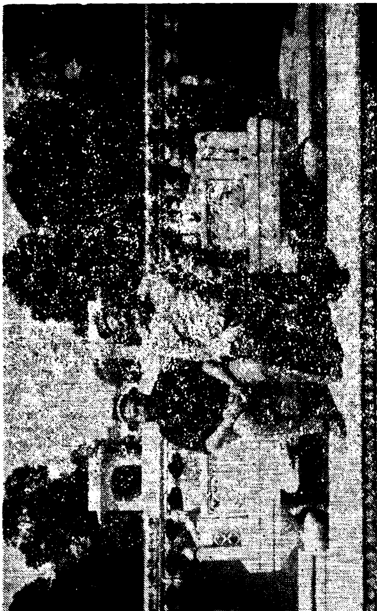
Тоҳурдаги Шалимар боғида.