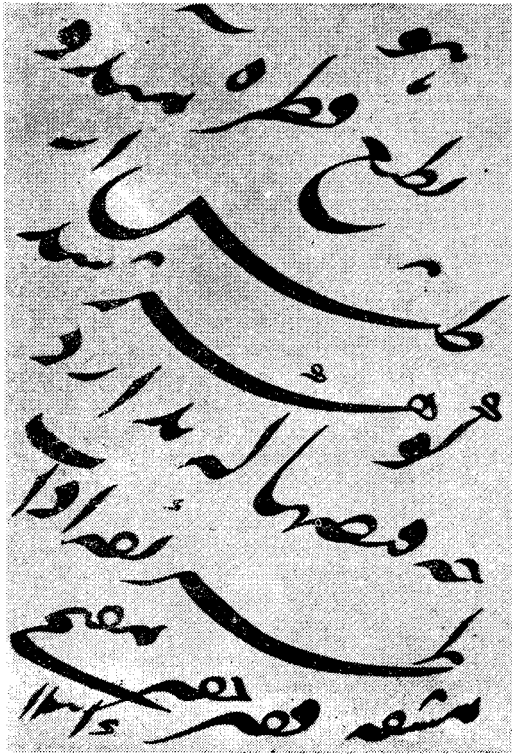
Каллиграфия санъатининг моҳир усталаридан бўлган Муқимийнинг ҳуснихат машқларидан бир намуна

унга моддий жиҳатдан ҳомийлик қилиб келган илм-маданият жонқуярлари эдилар.