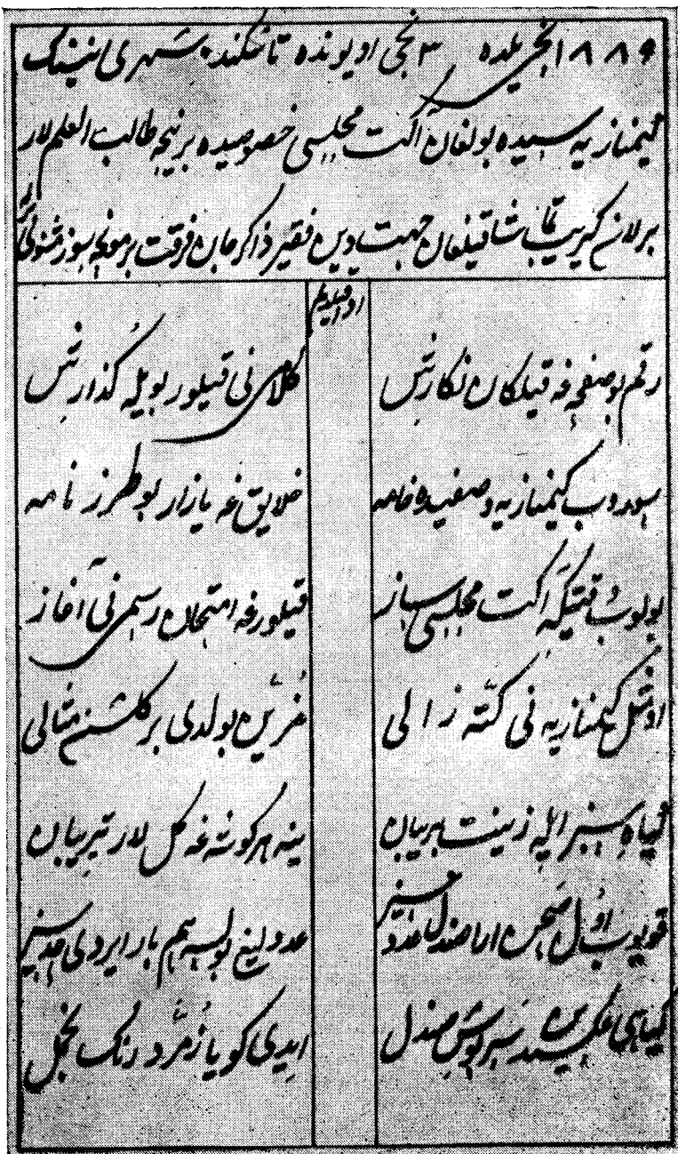
Фурқатнинг 1889 йил 3 июмда Ташкентда ёзган «Акт мажлиси хусусида» шеърининг асл қўл ёзмаси (литография)