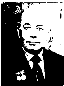
Иззат СУЛТОН (1910 – 2001)