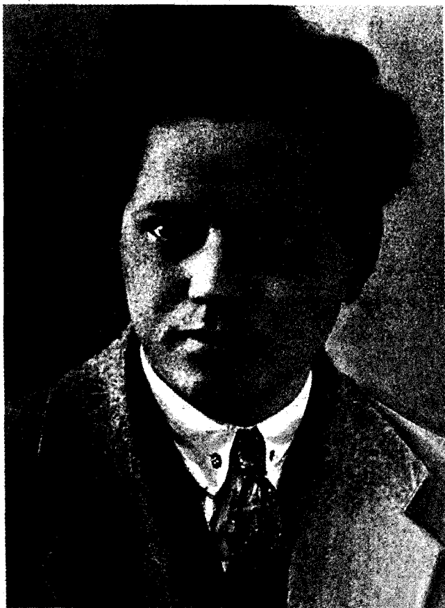
Ойбек. 1930 йил.

мен пианино чалишни сира билмайман. Пианино чалишни ўрганолмай, мусиқа мактабини ташлаб кетганман. Сўнгги йилларда эса ҳатто расм студиясига қатнашни ҳам тарк этганман. Икки институтда ишлаш, атамашунослик билан шуғулланиш, дарслик ёзиш, дарсликларни таржима этиш ва оналик вазифаси... булар менга жуда катта юк бўлиб, сутканинг 24 соати камлик қиларди.