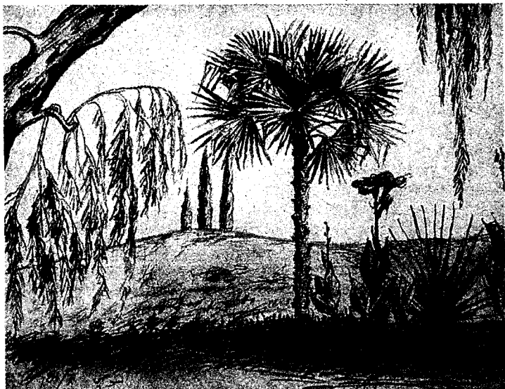
Крим манзараси. 3. Саидносирова чизган расм.

япти... Тўлқинлар зўр... Ёмғир қуйиб турибди... Мен ўйлайман: ер куррасида неча-неча денгизлар, неча-неча мухитлар бор; тўлқинларнинг кучи, қудрати миллион-миллион йиллар бўйи бекорга кетмоқда. Инсон нефть ёкиб, атомларни парчалаб, нима қиларди? Ҳолбуки, тўлқин кучи шу қадар зўр, шу қадар кўпки, бизга керакли энергия унинг кичик бир улушига ҳам тенг келолмайди.