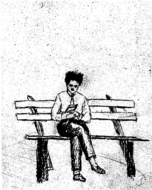
Ойбек. 3. Саидносирова чизган расм.

Бир нур дуч келса гоҳ япроқлар узра, Кўнглимда тошади севинч тўлқини. Йиллар ўтар, аммо ўчмас хотира Кўнглимда у нурнинг сўнмас ёлқини.