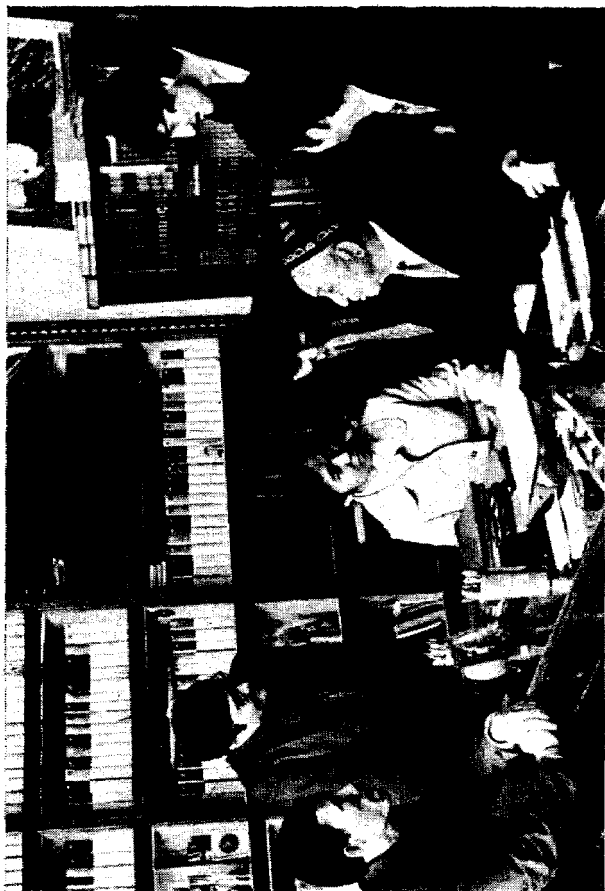
Ғаш шoirлар Миртемир ижодхонасида, 1975.