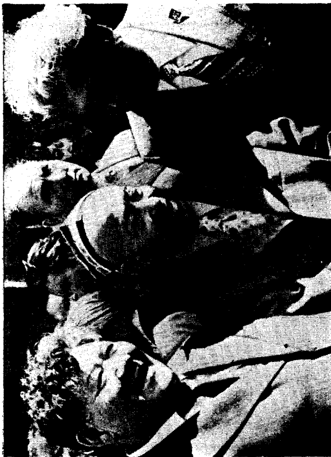
Миртемирни қозоқ адиблари ҳам, қирғиз адиблари ҳам «Бовурим» деб бежиз айтишмаган.