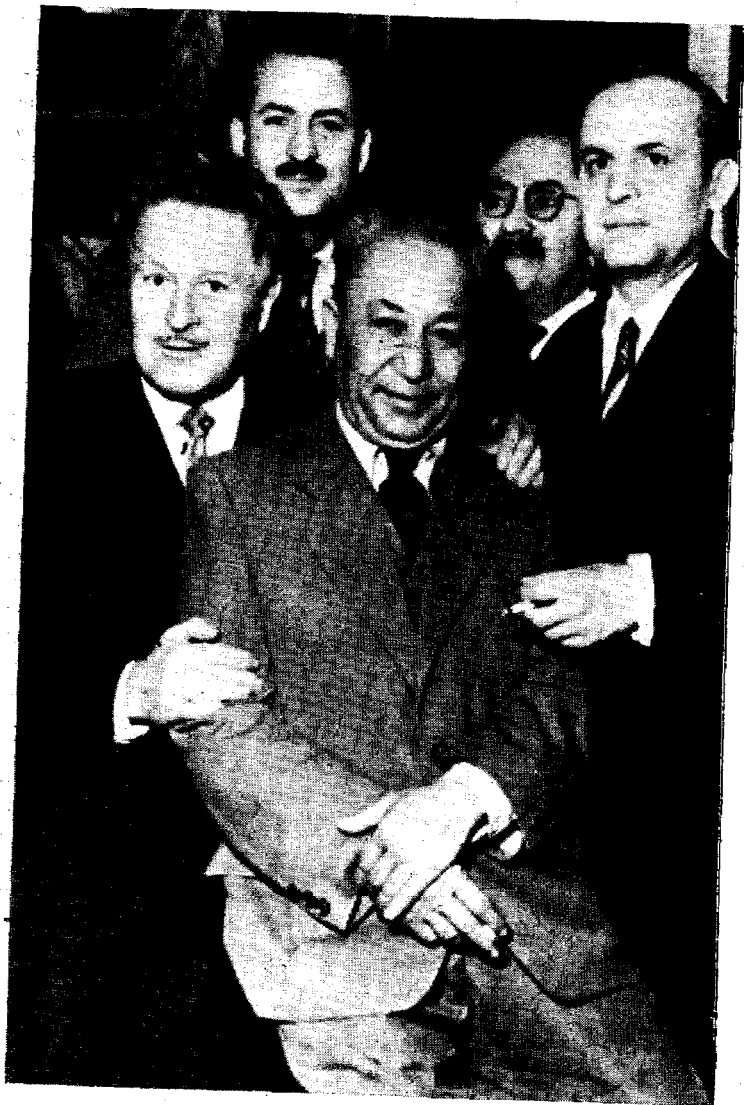
Миртемир шоир Нозим Ҳикмат ва бошқа қаламкаш дўстлари билан.