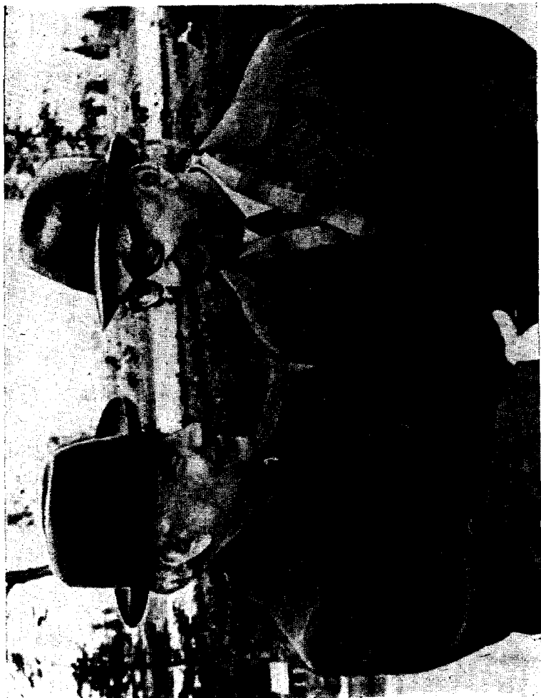
Миртемир академик Воҳид Зоҳидов билан суҳбатда.