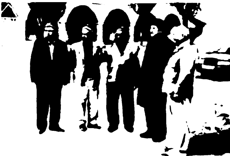
Чорсу. Мамадамин Дағар полвон ўғли номидаги ошхона