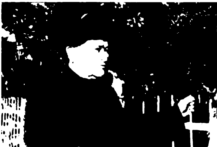
«Мир Жанда» қабристонини обод қилиш чоғида