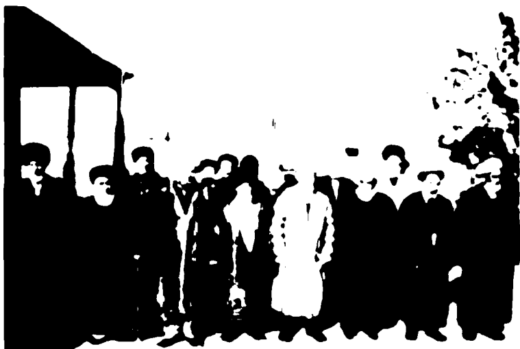
Дагар полвоннинг ворислари – қишлоқ аҳли