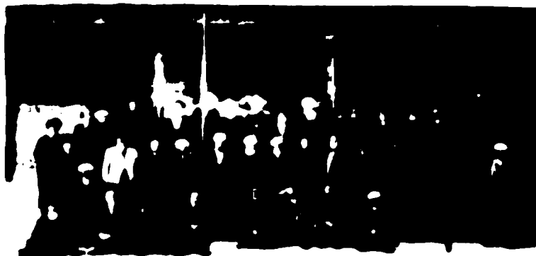
Дағар полвоннинг қариндош-уруғлари