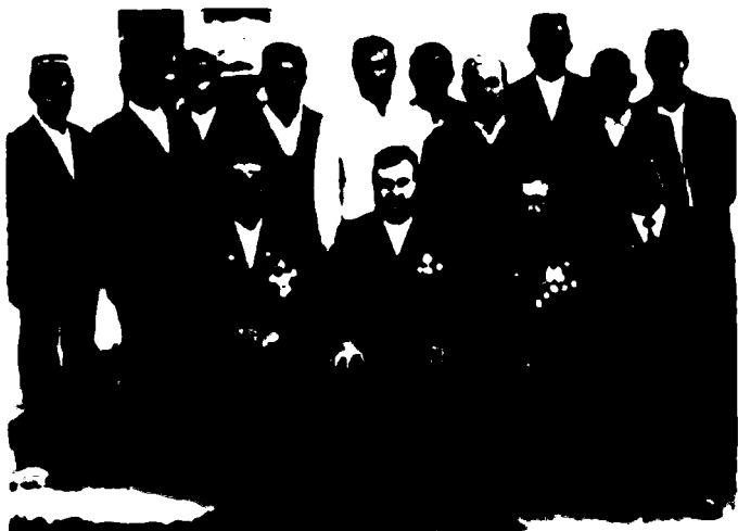
Молия соҳасидаги касбдошлар даврасида