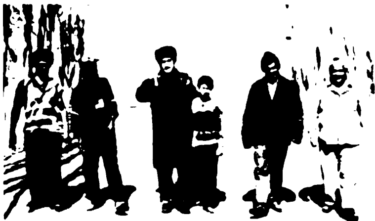
Ертепадаги ташландиқ ерда вузудга келган боғда