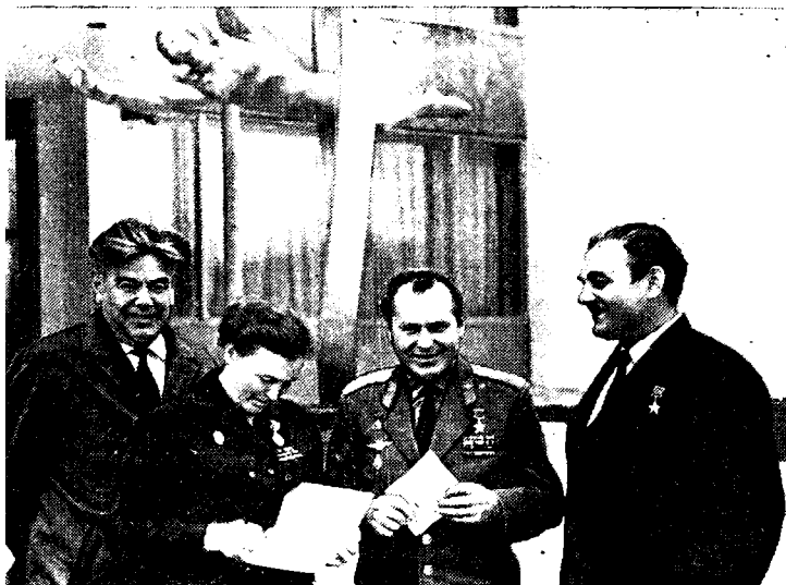
1. Ёзувчи Назир Сафаров космонавтлар диёри Юлдуз шаҳар- да. Унгдан чапга: ёзувчи, Совет Иттифоқи Қаҳрамони Владимир рлов, Совет Иттифоқи Қаҳрамони, космонавт учувчи Герман Ти- и, ҳарбий ёзувчи Надежда Мелагина ва Назир Сафаров. 1972.