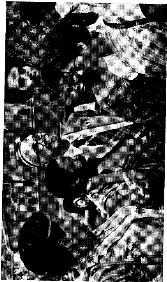
Ҳаким Назир Оснэ ва Африка мамлакатлари ёш ёзувчиларининг Тошкенда бўлган учрашуви иштигоқчилари орасида (1976 йил, сентябрь)