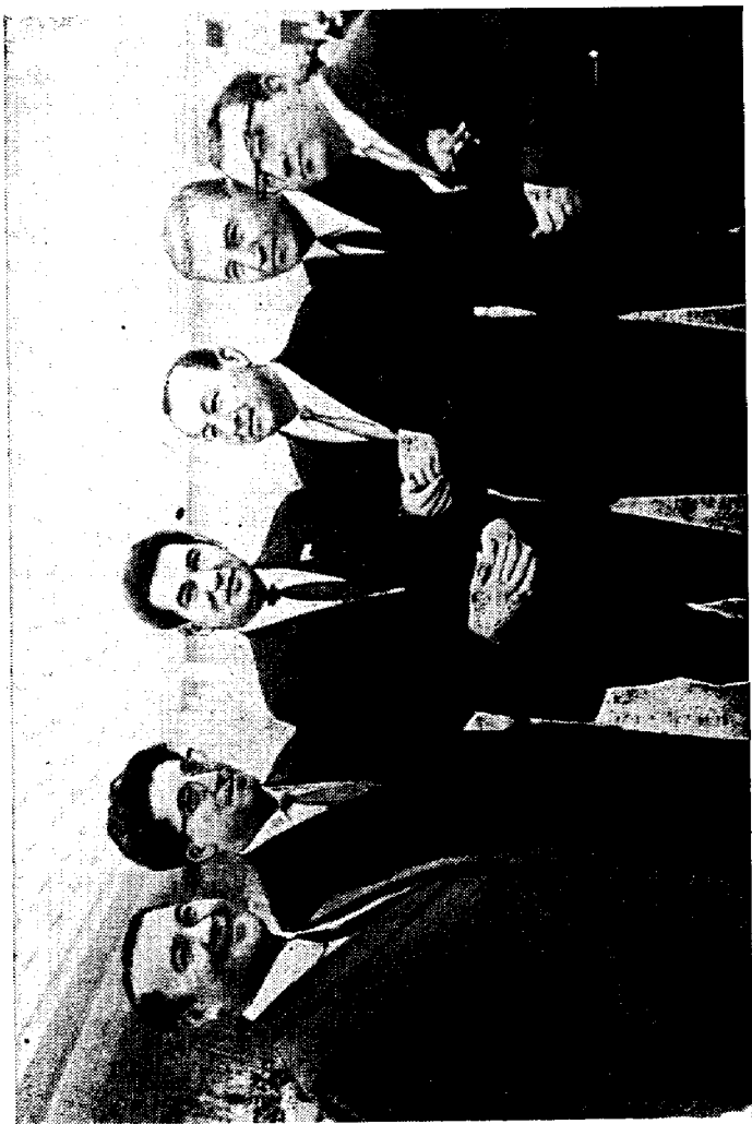
Бутуниттифоқ ёзувчилар IV съездида. 1967 йил, май.