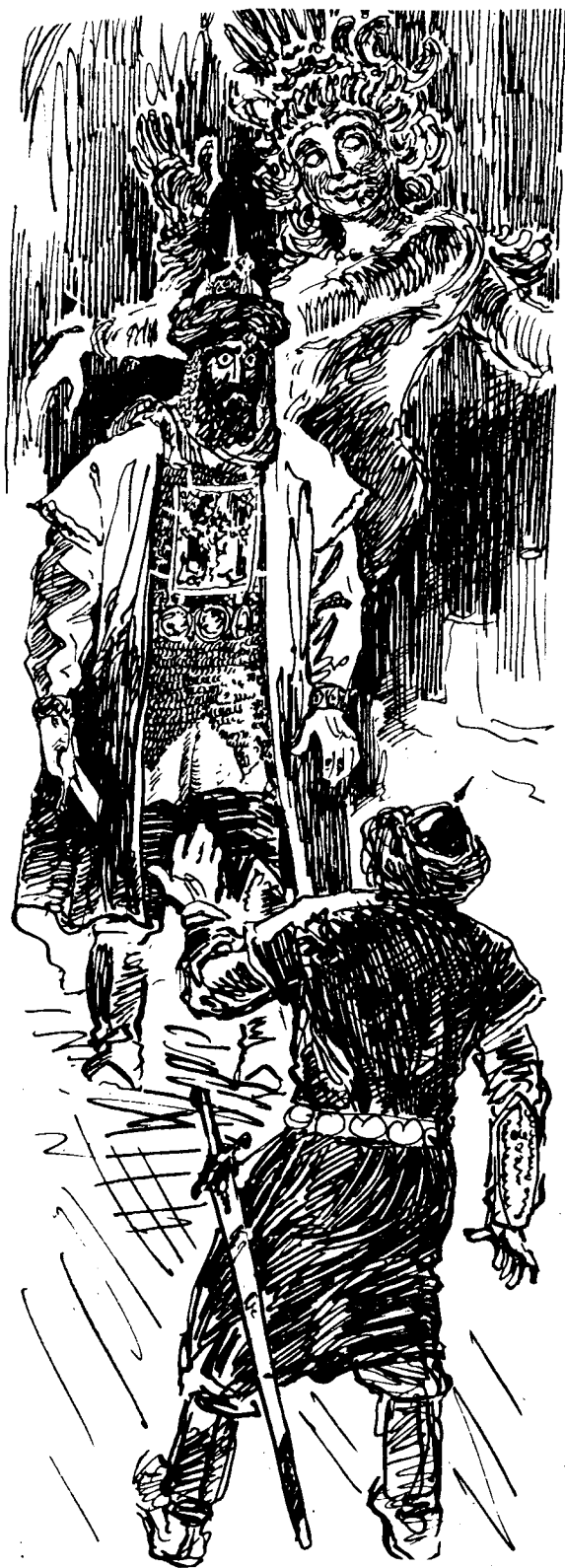
Расмларни В. Будаев чизган.

□ Бухоро халқи ёлғиз қолганди. Ёлғиз қолишидан ташқари, ички низоларга ҳам боған эди. Унинг ҳар бир шаҳри номигагина подшоҳ Тоғшодани тан оларди.