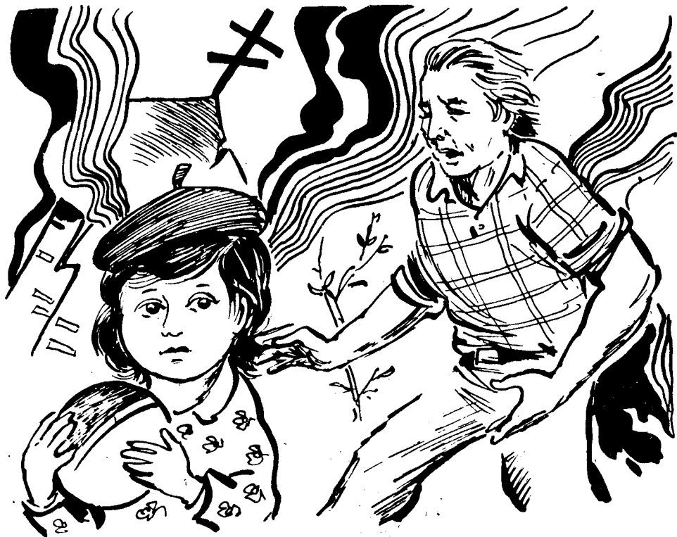
Расмларни А. ХОЛИҚОВ чизган.

— Нянецка!— Борька оппоқ мўйловли, паст бўйли эшик оғасининг