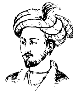
Заҳириддин Муҳаммад Бобур

ЧАКАНА САВДОДА БАҲОСИ КЕЛТИРИЛГАН НАРҲДА «Шарқ» нашриёт-матбаа концернининг босмаҳонаси, 700083, Тошкент шаҳри, Буюк Тўрон кўчаси, 41