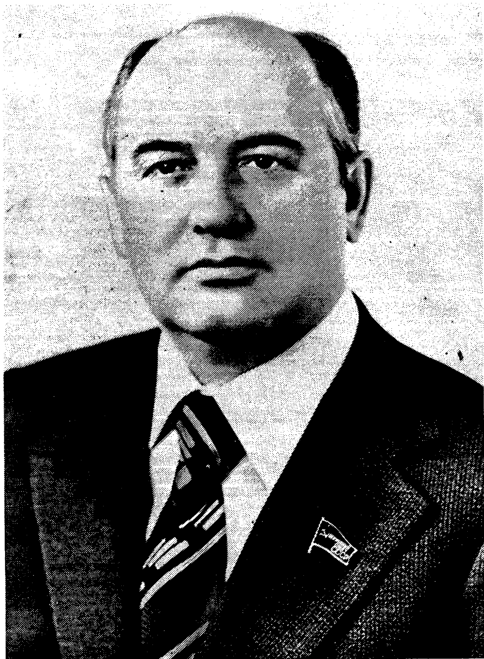
КПСС МАРКАЗИЙ КОМИТЕТИНИНГ БОШ СЕКРЕТАРИ Михаил Сергеевич ГОРБАЧЕВ