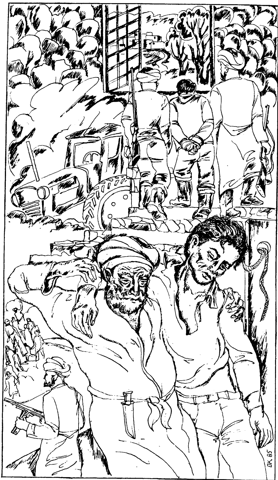
Расмларни Ортиқали ҚОЗОҚОВ чизган