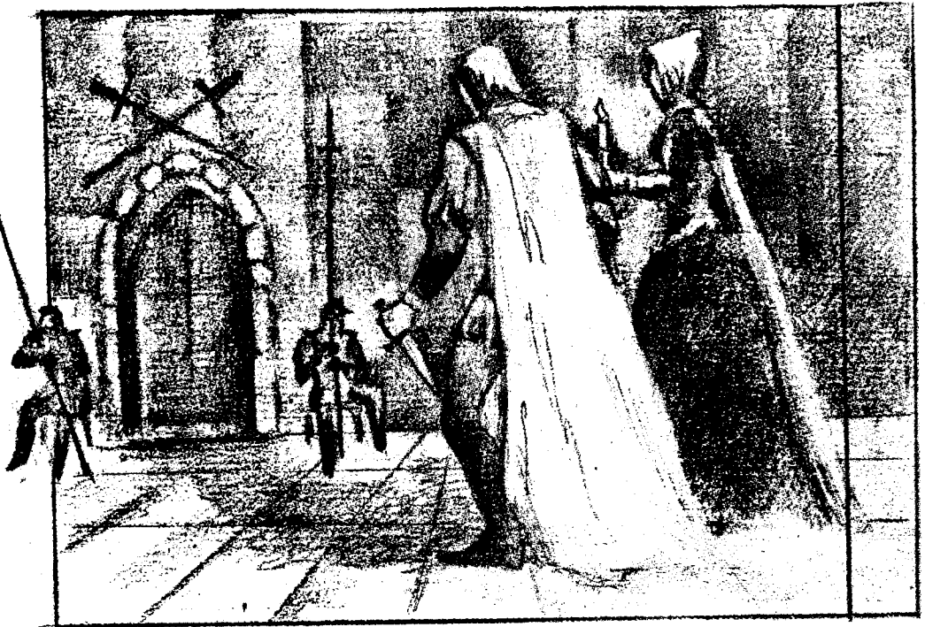
Расми Аваз ШОАЛИМОВ чизган

Ҳам меҳрибон, ҳам болажон шундай отани Фарзандлари сўйиб қўйса, — ғоят таажжуб! Ҳаммадан кўп ачиди-я, Макбетнинг ичи! Заб пайтида, чин-ҳақпараст ғазаб қўзгаб, Маст уйқуга ширин жони садақа кетган, Бир жуфт соқчи — пес-моховни ўлдиргани-чи? — Бундай бўпти, садоқат ҳам фаросат деган! Турган гапки, мункир келиб, бу икки сурбет, Ўрлик билан бошимизни қотирар эди. Яна, Малькольм ва Дональбайн, худо асрасин, Е Флинс ҳам тушиб қолса борми қўлига, Кўзларига кўрсатарди падаркушликни! Аммо хап тур. Ҳақиқатни билганинг билан, Уни очиқ сўзлайдиган замонлар ўтди. Ана Макдуф, тилига эрк бергани учун, Меҳмонликка бормагани баҳонасида, Мустабид шоҳ ғазабига учраб турибди. Айтмоқчи, у қочган дейди, қаерда ҳозир?