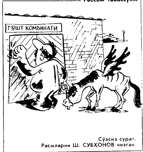
Сўзсиз сурат. Расмларни Ш. СУБХОНОВ чизган.