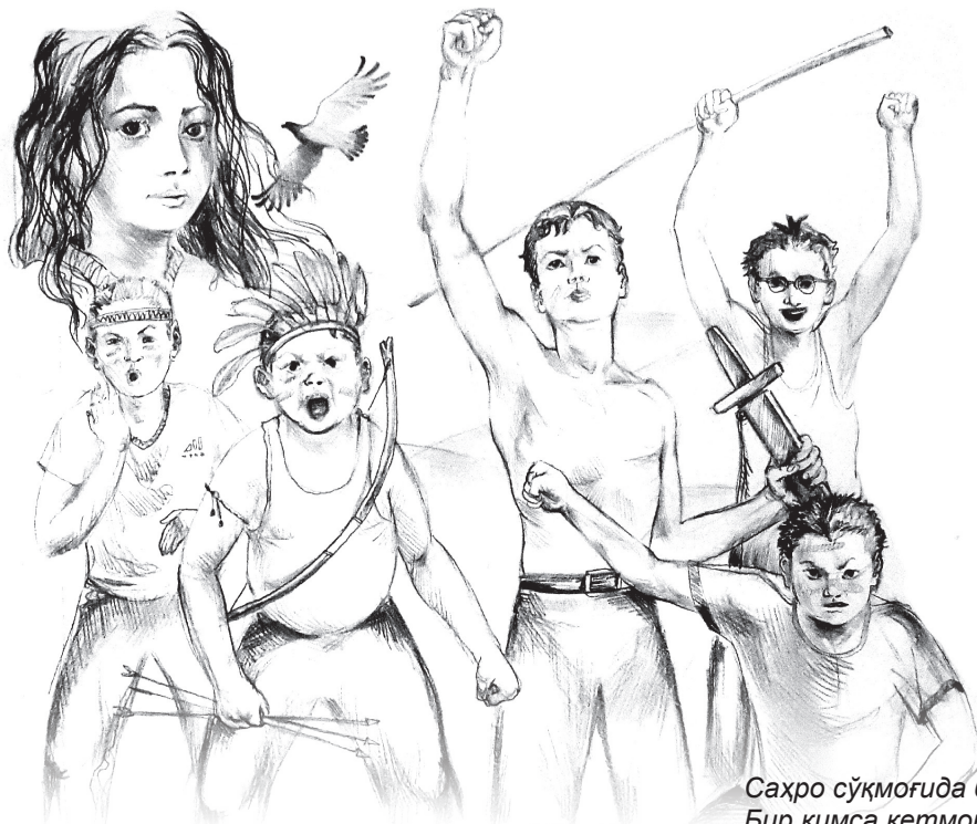
Расмларни Оловуддин Собир ўгли чизган