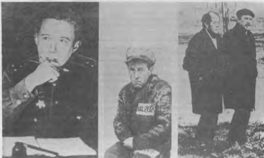
Суратларда: А. Солженицин фронтда, ҳибсда ва хорижда.