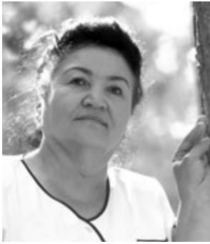
Enaxon SIDDIQOVA, O'zbekiston xalq shoiri