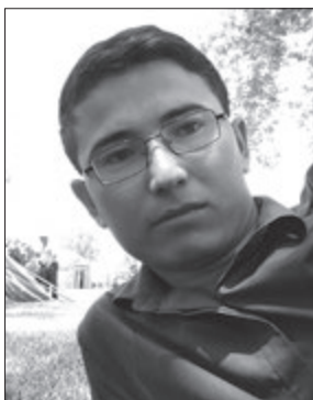
Shahobiddin Luqmon Tog'larga tirmashib tong otar mudom...