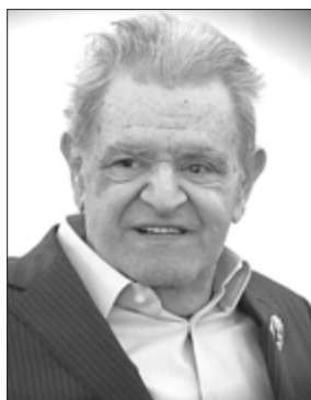
Fozil Iskandar Yozuvchining o'ylari