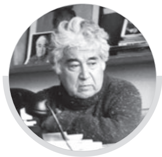
Aziz NESIN (1915–1995)

Turk hajviy yozuvchisi, dramaturg. “Bir surgun xotiralari”, “Unutilmas orzular”, “Vijdon ishi” kabi romanlari, “Shunday bo’ldi, bunday bo’lmaydi” avtobiografik qissasi, “Aziznoma” hajviy she’rlar va “Mamlakatlardan birida” hajviy hikoyalar to’plamlari mashhur. “Musht ketdi”, “Hushtak afandim”, “Futbol qiroli” va boshqa asarlari o’zbek tiliga tarjima qilingan.