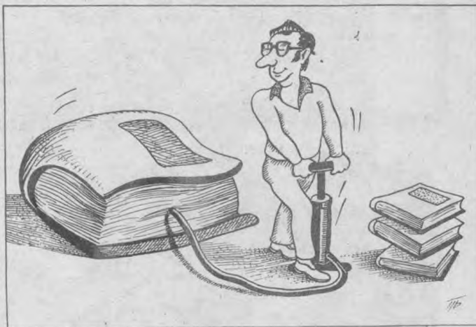
Китобни «семиртириш» йўли.