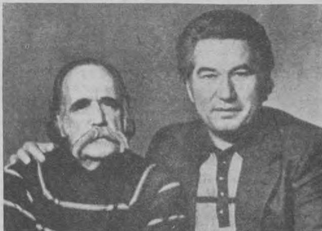
Уильям САРОЯН совет адабиётига катта қизиқиш ва эҳтиром билан қарарди. У мамлакатимизнинг кўпгина атоқли адиблари билан қалин ижодий алоқаларда бўлган. С у р а т д а: машҳур қирғиз ёзувчиси Чингиз АЙМАТОВ ва Уильям САРОЯН.

Тоғамнинг ўзи-ку, ҳар бир ютқизиғини оламшумул фожиядай кечирар, лекин ютқизиқни кўтаролмаган бошқа ҳар қандай одамни еб юборгудай бўлар эди.