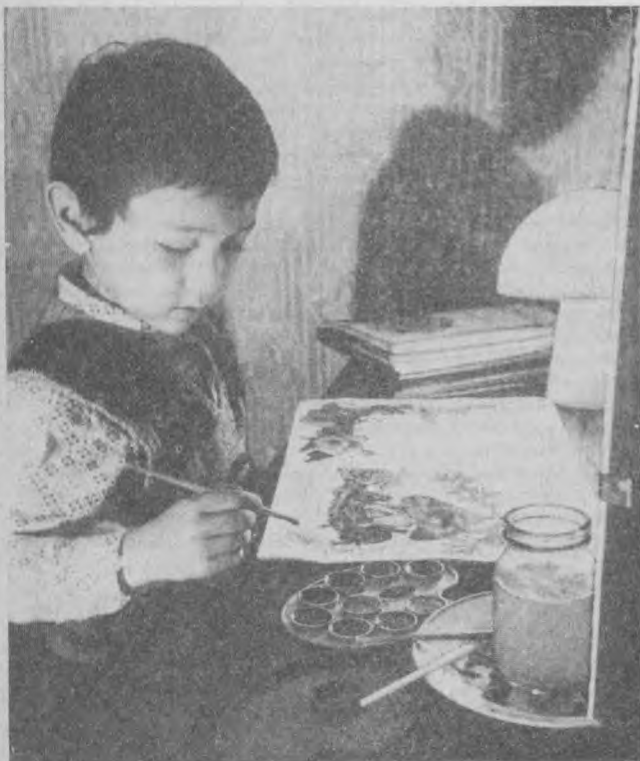
«Дабатта рассом бўламан!»