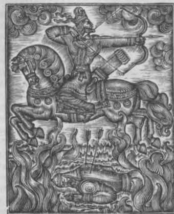
Рассом И. КИРИАКИДИНИНГ Пахлавон Махмуд рубойлари ва Фирдавсийнинг «Шоқнома» асарига ишлаган суратлари