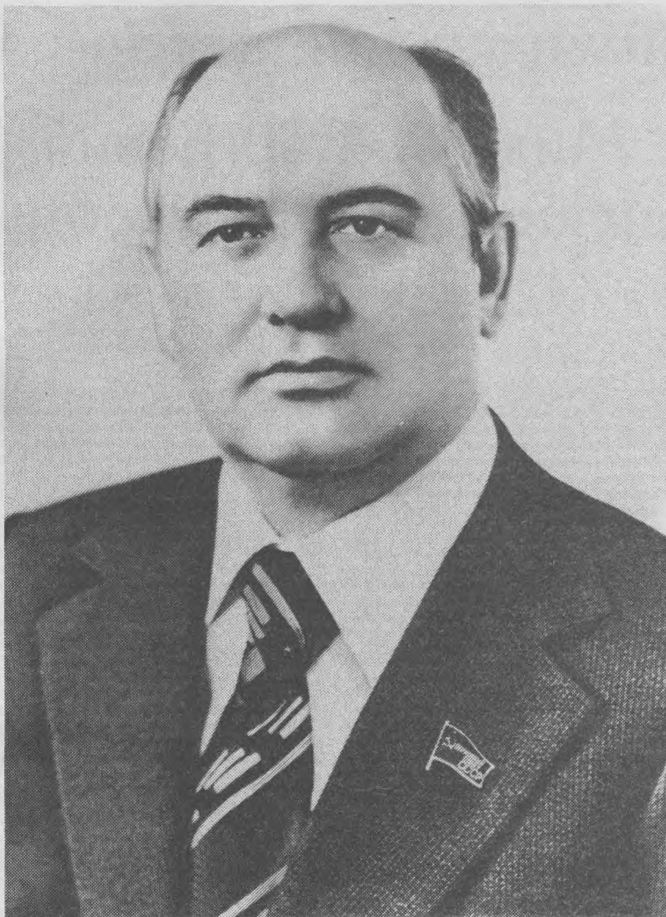
Михаил Сергеевич Горбачев