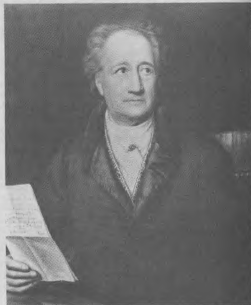
Иоганн Вольфганг Гёте