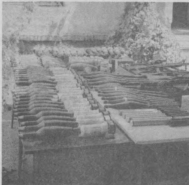
Афғонистон душманларидан қўлга туширилган ўлжалар — чет элларда тайёрланган қурол-яроғлар.

Душманлар (Афғонистонда инқилоб душманларини шундай аташади. Бу сўз «Ашор» — босмачи деган сўзни ҳам сиқиб чиқарди) ҳар қандай ваҳшийлик, ёвузлик қилишдан тап тортмайдилар. Уларнинг бундай разилликлари маълум даражада АҚШ, Исроил, Англия ва бошқа капиталистик давлатлардан экспорт қилинмоқда. Чунки бу мамлакатларда риёкорлик, инсоний муносабатларнинг энг оддий нормаларини топташ