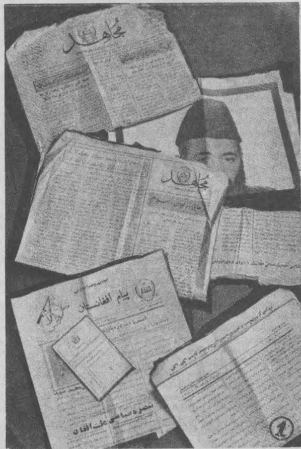
Аксилнқилобчилар чет элларда чоп этаётган, инқилобий Афғонистонга душманлик рўҳи билан сўғорилган нашрлар.

Унинг авлодлари қадимдан Пактияда пуштуларнинг диний пешволари бўлиб келишган. Балки шунинг учун бўлса керак, Гилони бир неча йил мобайнида, то 1973 йилгача Зоҳиршоҳнинг норасмий маслаҳатчиси бўлиб келди. Ҳатто унинг неварасига уйланди. Афғонистонда Довуд диктатураси ағдариб ташлангач, унинг бу ерда қиладиган иши қолмади. Шундан кейин ўзининг Фарбдаги алоқаларидан кенг фойдаланиб, қуролли гуруҳлар тузишга фаол киришди. Баъзи маълумотларга қараганда, Гилони 60 минг кишилик босқинчилар армиясини ташкил этишни ўз олдига мақсад қилиб қўйган. Бу ишларда унга Вашингтондаги «Халқаро полиция академияси» ва «Техас кўпоровчилар билим юрти»да таълим олиб келган