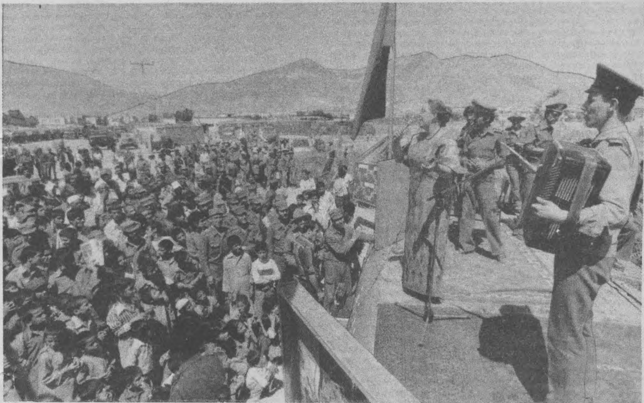
Совет артистлари афғон қишлоғида.

Бу уларнинг ўзаро тўқнашувларидан мисоллар, холос. «Ислом қўмиталари» ва босмачи тўдалари аслида АДР ҳукуматини қувватловчи тинч аҳолига қарши курашни ўзларининг бош вазифаси деб ҳисоблайдилар. Афғонистонга Эрондан ўтказилаган ғалати бир китобча уларнинг ҳаракат тактикалари, кураш усуллари, аксилинқилобий партияларнинг раҳбарларидан олиб турган мафкуравий дастуриламаллари ҳақида очик-ойдин ҳикоя қилади. У «150 савол ва жавоб» деб