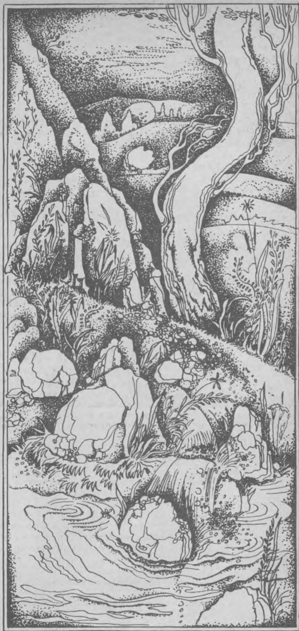
Расми Х. ЛУТФУЛЛАЕВ чизган

Муқованинг биринчи ва тўртинчи саҳифаларини расм О. БОБОЖОНОВ ишлаган.