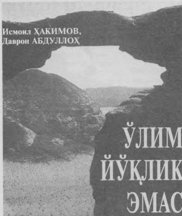
Исмоил ҲАКИМОВ, Даврон АБДУЛЛОҲ