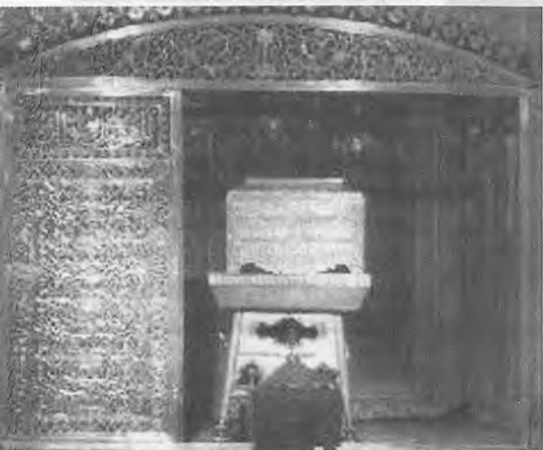
Истанбул шаҳридаги Тўпқопи музейида хирқаи шариф сақланаётган сандиқ

Аллоҳ таолога ҳамду санолар, Муҳаммад Пайғамбаримизга (алайҳиссалом) дуруду саловотлар бўлсин.