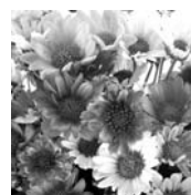
Ўрта Чирчиқ тумани

Ҳозирги болалар ямоқни билмайди, Оҳорсиз либосни назарга илмайди. Иқтисод, исрофга ким эътиборсиз, Ризқ-рўзи ҳеч қачон тўқис бўлмайди.