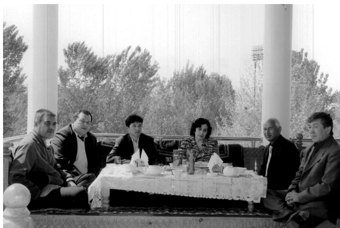
“Нафосат” чилар Турсунзодада