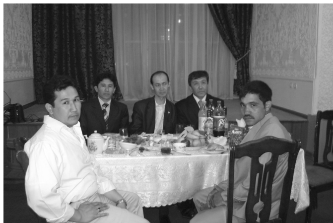
Шоир “Замондош-шоу” да дўстлари билан.