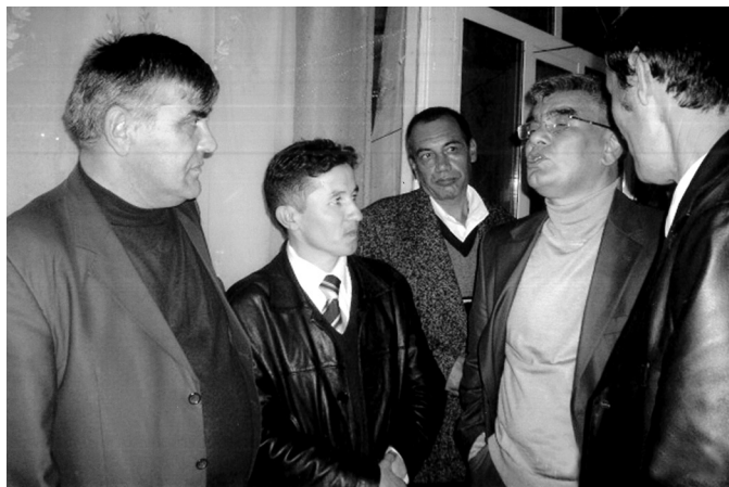
Ўзбекистон халқ шоири Усмон Азим суҳбатида. куз 2008 йил.