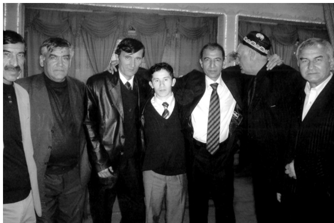
Ўзбекистон халқ шоири Сирожиддин Саййиднинг 50 йиллик юбилейида куз 2008 йил.