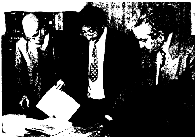
Ҳиндистон, Патна (собиқ Азимобод) шаҳри кутубхонасида Мирзо Абдулқодир Бедил асарлари билан танишув.