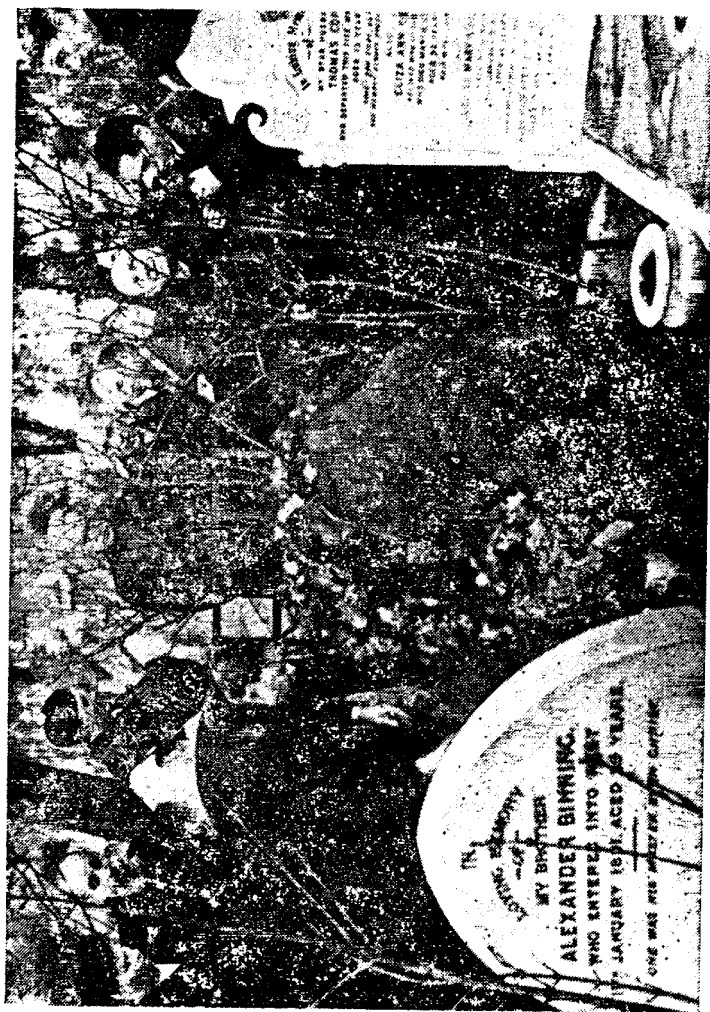
Ойбек (ўндан иккинчи) СССР Олий Совети депутатлари билан биргаликда Карл Маркс қабрига гулчамбар қўймоқда. Лондон, 1947 йил.