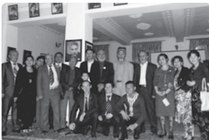
Парасту 2013 фестивалида (Душанбе)