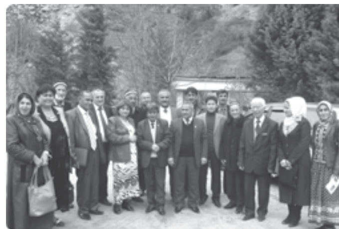
“Болалар адабиёти ҳафталиги” фестивали Варзобда