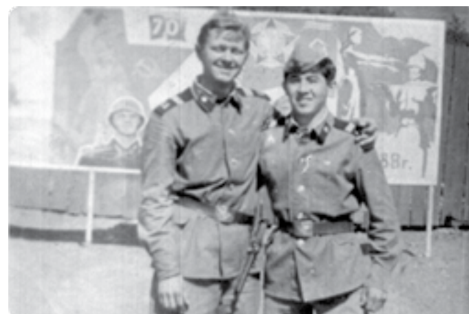
Совет Армияси сафларида (1987-89 йиллар)