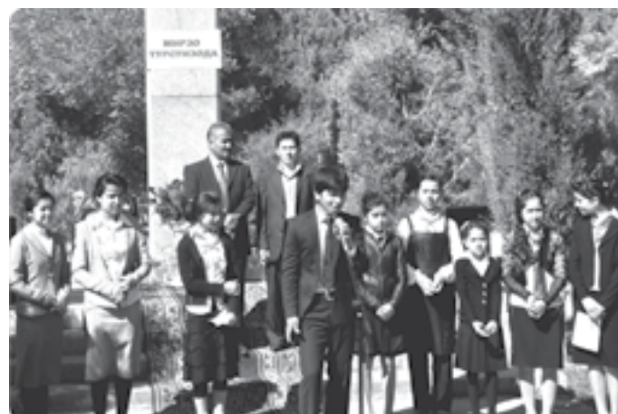
Турсунзодада - турсунзодахонлик (02.05.2013)