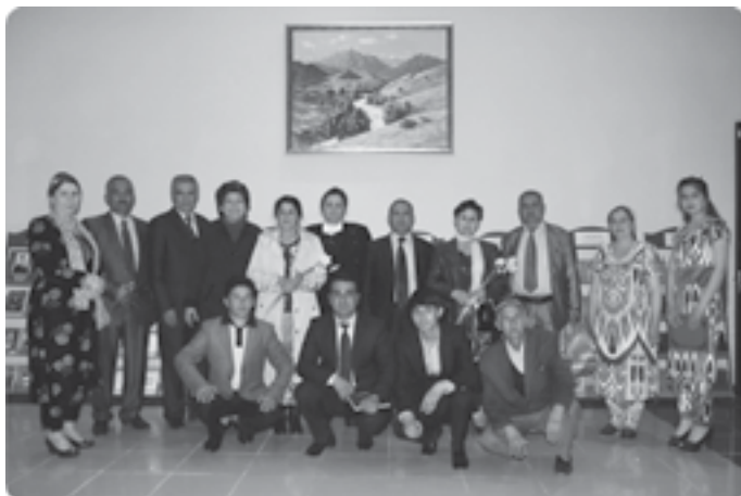
“Болалар адабиёти ҳафталиги” фестивали Турсунзода шаҳрида