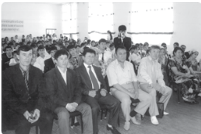
Қўрғонтепа шаҳридаги ижодий учрашув