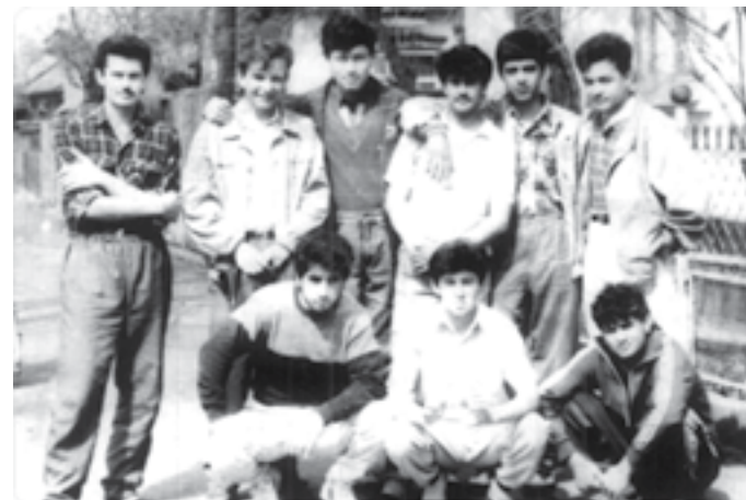
Талабалик йилларим, Олма Ота шаҳрида (1991 йил)