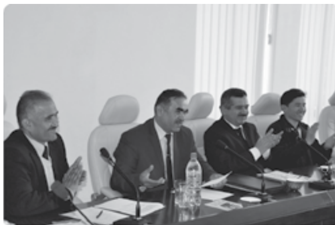
Турсунзодада “Назм Мавжлари” мушоираси