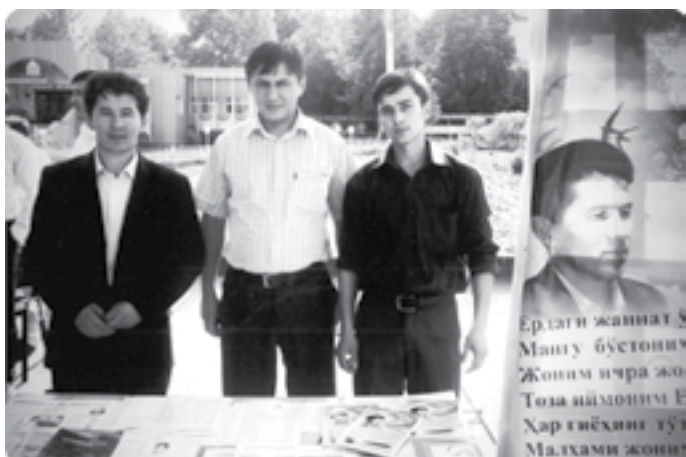
“Ҳажрида қуяр кўнгил” китобининг тақдимот маросими (2012 йил)