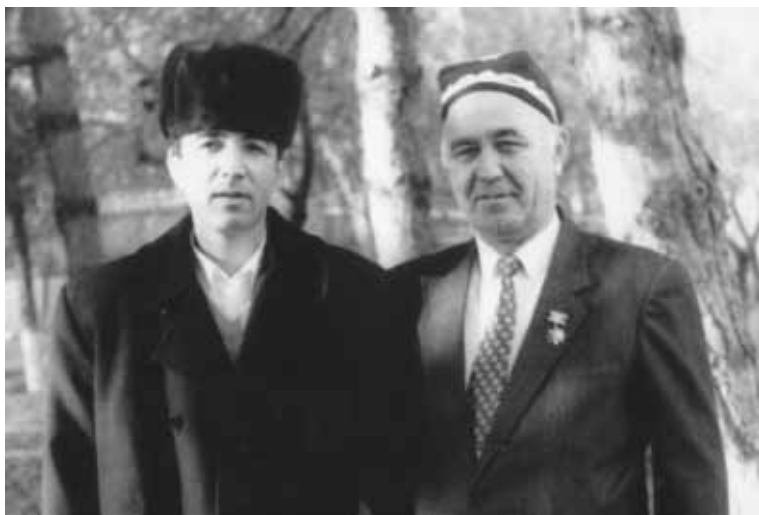
Ўзбекистон қаҳрамони, машҳур раис Иброҳим Файзуллаев билан, 2002 йил