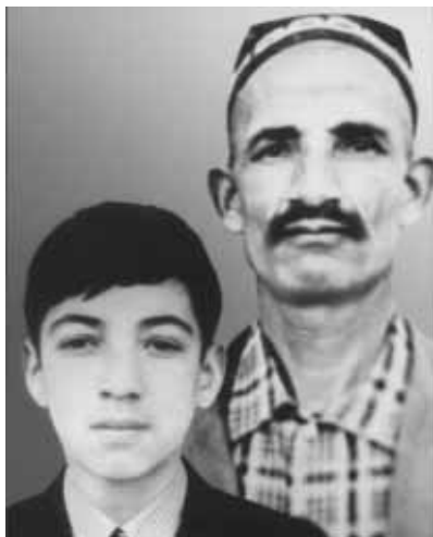
Ўн тўрт ёшимда. Отам билан. 1972 йил