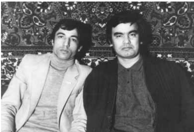
Ўзбекистон халқ шоири Усмон Азим, 1985 йил