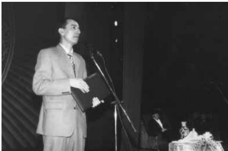
Халқ шоири Тўра Сулаймоннинг 70 йиллик тўйида. Гулистон, 2003 йил