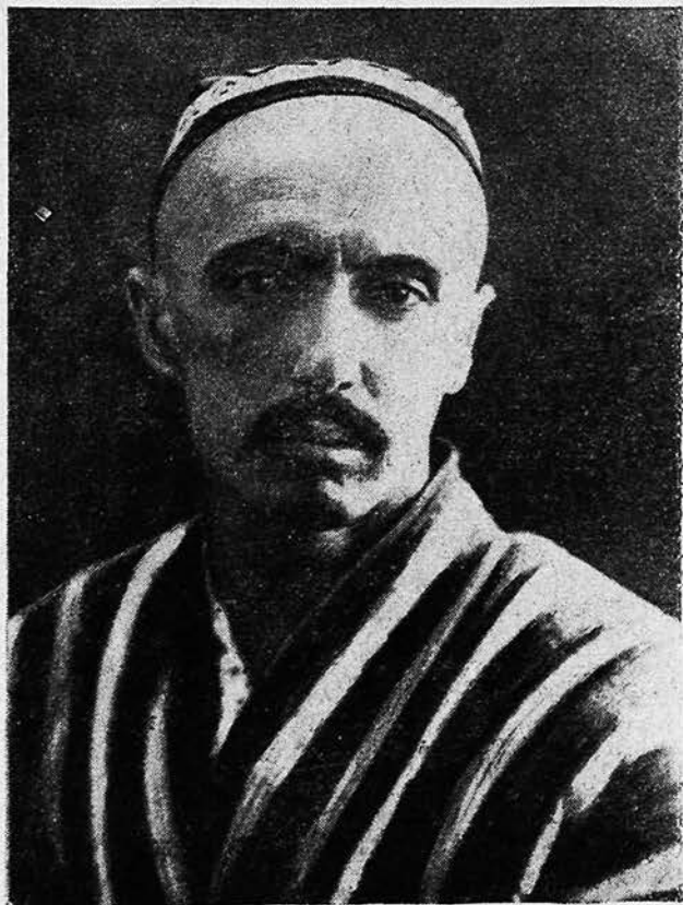
Хамза Хаким-заде Ниязи.

Прекрасный знаток и ценитель музыки, вдумчивый ученый-музыковед, он оказал большое плодотворное влияние на развитие всей узбекской советской музыкальной культуры.