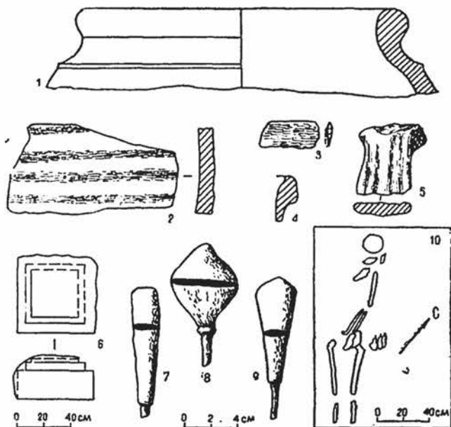
Рис. 2. Керамика, стрелы, база колонны и план погребения с городища Пиль-кала.

Для датировки сооружения, расположенного в юго-восточном углу городища, и соотношения его с крепостью к северу от этого сооружения были произведены поверхностные зачистки на крепостной стене. Сооружение имеет квадратную в плане форму и сильно выдается за стены стрелко-