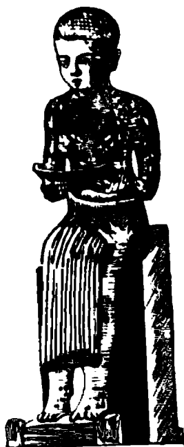
Qadimgi Misrliklarning tibbiyot xudosi. Imxoteb

Shu sababdan o'lgan kishining jasadini aholi yashaydigan yerdan uzoq joyga olib borib, tepalik yerlarda ochiq qoldirganlar. U yerda murdani yumshoq qismlarini yirtqich hayvonlar yeb tugatganlaridan so'ng, uning suyaklarini yig'ib olib kelib, ossuariy (suyakdon)larga solib, uyda maxsus qurilgan katak(tokcha)da saqlaganlar. Bizning o'lkamiz hududida arxeologik qazilmalar vaqtida bunday ossuariylar ko'p topilgan.