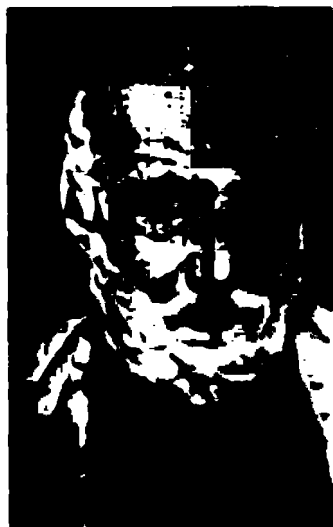
Jahon ilmiy tibbiyotiga asos solgan mashhur hakim Hippokrat. (460—377)

bilan davolash (dorivorlik) va avrash, ya'ni afsungarlik. Hozirgi zamon fani nuqtai nazaridan oxirgi usulni psixoterapiya, deb atash mumkin. Ammo, u zamondagi tabiblar bu usulning mohiyatini boshqacha tushunganlar. Ularning fikricha, kasallikni johil kuchlar keltirib chiqaradi va uni avrash usullari bilan tanadan chiqarib yuborish mumkin, deb o'ylaganlar. Bu usul davolashning asosiy usuli hisoblangan.