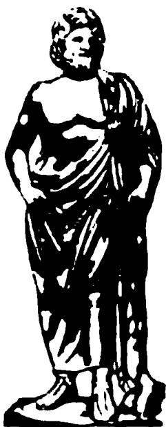
Qadimgi yunonlarning tibbiyot xudosi Asklepiy

olgan joyidan ko'chirib (haydab) yuborish deb atalgan.