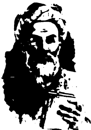
Abu Ali ibn Sino (980-1037)

bo'lmaydigan asar» deb sotib olishdan bosh tortadi. Ammo, kitobfurnish — «bu kitobning egasi pulga juda muhtoj, uni arzonga — 3 dirhamga beradi, ol» deb Ibn Sinoni ko'ndiradi. Ibn Sino noiloj kitobni sotib oladi va uyga kelib, uni o'qib chiqib «Mo ba'da at-tabia»ning mazmunini tushunib oladi. Ibn Sino bu voqeani shogirdi Abu Ubayd Juzjoniga aytib berib, uni quyidagi so'zlar bilan tugatgan ekan: «Bundan men o'zimda yo'q sevinib ketdim va tangri taolaga shukur aytib, o'sha kunning ertasiga kambag'allarga ancha sadaqa ulashdim».