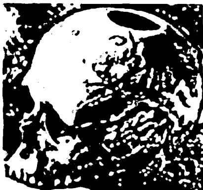
Trepanatsiya qilingan bosh suyagi.

Kishilik jamiyati taraqqiyotining ma'lum davriga kelib patriarxat bilan almashdi. Erkaklar moddiy boyliklarni o'z qo'llariga oldilar. Buning natijasida ular oila va qabilada yetakchi mavqei egalladilar. Oila va qabilaning hayoti va sog'ligi haqida qayg'urish ham erkaklar zimmasiga tushdi. Shuning uchun ular muolaja ishlari bilan shug'ullana boshladilar. Odatda bu ish bilan ko'proq yoshi ulug'roq, katta hayot tajribasiga ega bo'lgan kishilar shug'ullanganlar.