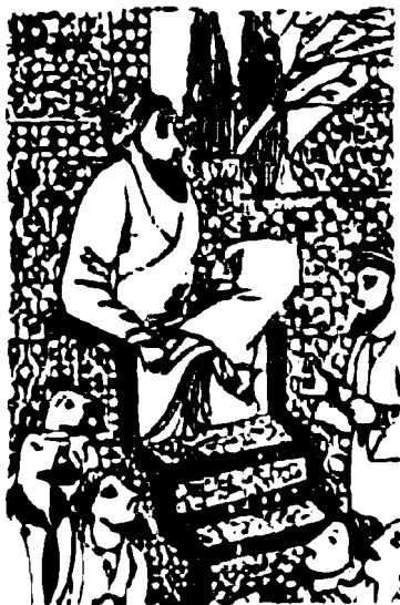
Ibn Sino talabalar bilan dars o'tmoqda

haqidagi qismini tugatgan. Aristotelning falsafiy asarlariga sharhlar yozgan.