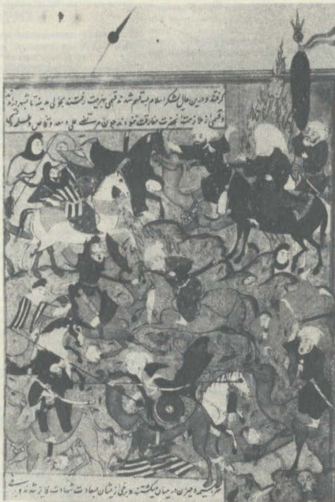
Муҳаммад пайғамбар (юзига парда тўсилган) Убуд тоғида жангнинг боришини кузатмоқда.