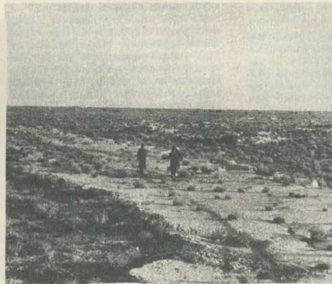
Қадимги суғорилган ерлар. Кўҳна канал излари. Варахша. Аркадаги қазилмалар.

Бу маълумотларни ҳам археологик тадқиқот натижалари маълум даражада тасдиқлади. Топилмаларга қараганда фақат овчилик ва балиқчилик билан кун кечирган Бухоронинг энг қадимги аҳолиси милoddан аввалги 5—3 мингинчи