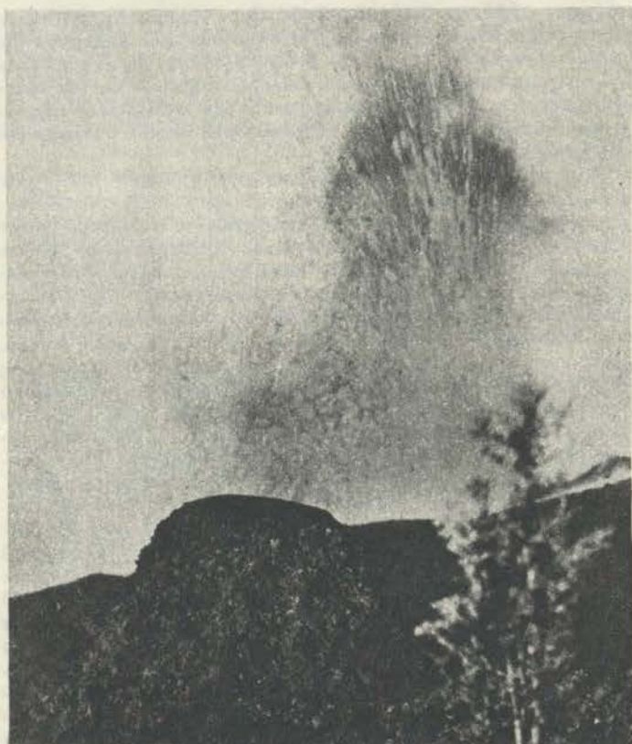
Вулқон шунчаки табиий офат эмас, балки қудратли энергия манбаи ҳамдир.

Ҳозирги вақтда замонавий манбалардан энергия олиш билан экология ўртасида зиддият мавжуд. Энергиянинг