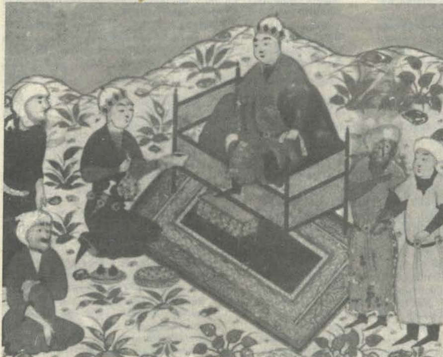
«Шоҳ ва икки сайёҳ». Алишер Навоийнинг «Лисон ут-тайр» асарига ишланган миниатюра.

Агар мафкуравий қарашлар демократик ҳуқуқий кўп миллатли давлатнинг конституциясига хилоф бўлмаса, мазкур давлатда муайян этнолингвопанизмга мансублик тамғасини босиб, қатағон усуллари қўллашни адолатга зид деб билиш керак. Акс ҳолда ажралиб чиқишгача бўлган миллатларнинг ўз тақдирини ўзи ҳал қилиш умум-демократик ҳуқуқи тугул, ҳатто