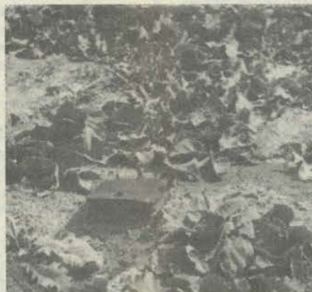
Орол бўйидаги ўта ноқулай табиий шароитга дош бериб унган қатран (биринчи ва иккинчи йил ниҳоллар).

Кузда экилган қатран уруғлари қиши билан тупроқ остида қолиб, эрта баҳор униб чиқди. Қатран биринчи йили илдииз бўғизидаги куртақлардан барглар ўсиб ёпирмабарг ҳосил қила-