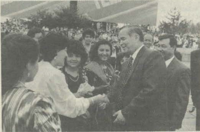
Ўзбекистон Республикаси Президенти Ислом Каримов муҳим давлат ишларидан бўш вақтида фуқаролар билан учрашиб халқнинг ҳол аҳволидан хабардор бўлиб туради.

74 йиллик большевизм асорати ва зулмидан озод бўлиб истиқлолга эришган Ўзбекистоннинг қонуний Президенти Ислом Каримовнинг сайи ҳаракати туйғайли қисқа давр ичида оламжаҳон ишлар амалга оширилдики, халқимиз ҳали бундай улкан ўзгаришларни кўрмаган. БМТ ва 90 дан зиёд хорижий давлатларнинг Ўзбекистонни тан олганлиги — бу мамлакатимизни жаҳон эътироф этганлигидан далолатдир.