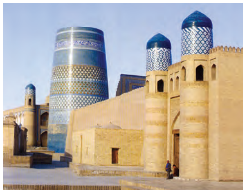
Xiva — qadimiy shahar