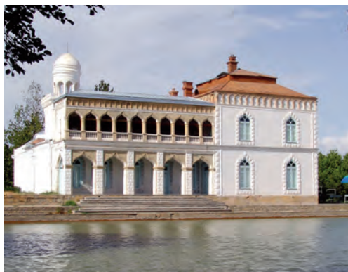
Buxoro — tarixiy obidalar shahri