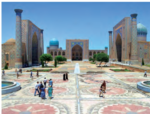
Samarqand — Sharq durdonasi