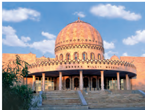
Nukus — baxshilar yurti